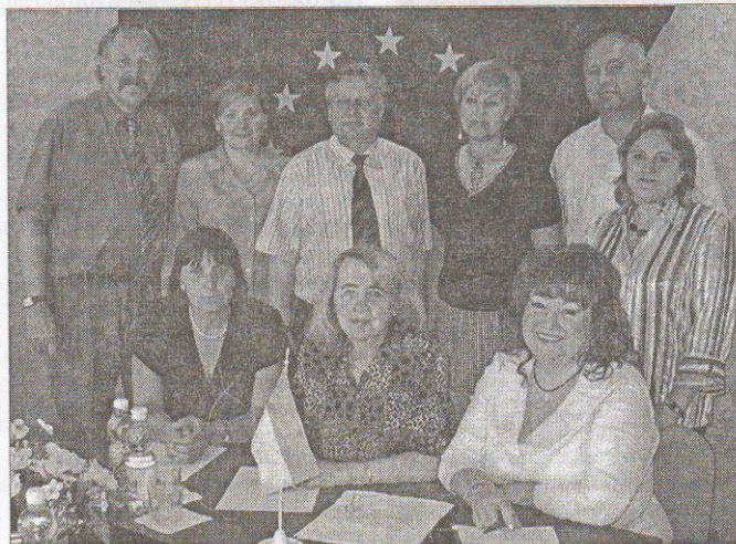
Учасники проекту «Підвищення ефективності управління ПТО на регіональному рівні в Україні»

Спільно з Кримським інженерно-педагогічним університетом, Кримським інститутом післядип-