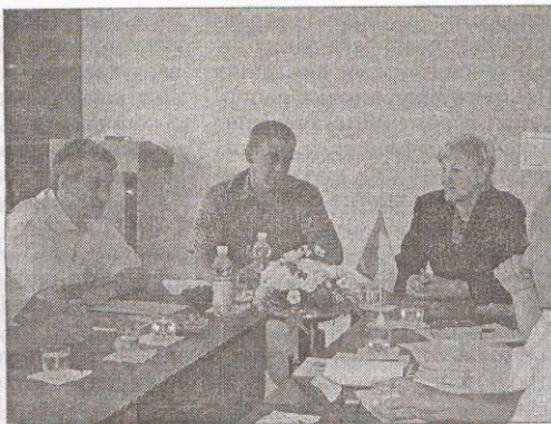
Обговорення проекту «Енергоефективність в ПТО і на виробництві»

теорії й практики управління освітніми системами. У зв'язку з цим зумовлюється необхідність теоретичного обґрунтування й розробки стратегії управління системою професійно-технічної освіти на загальнодержавному, регіональному рівні, на рівні ПТНЗ, а також розробки науково-обґрунтованих рекомендацій щодо нових технологій і механізмів управління сучасним ПТНЗ, оновлення функціональних обов'язків керівних та інженерно-педагогічних працівників системи ПТО: