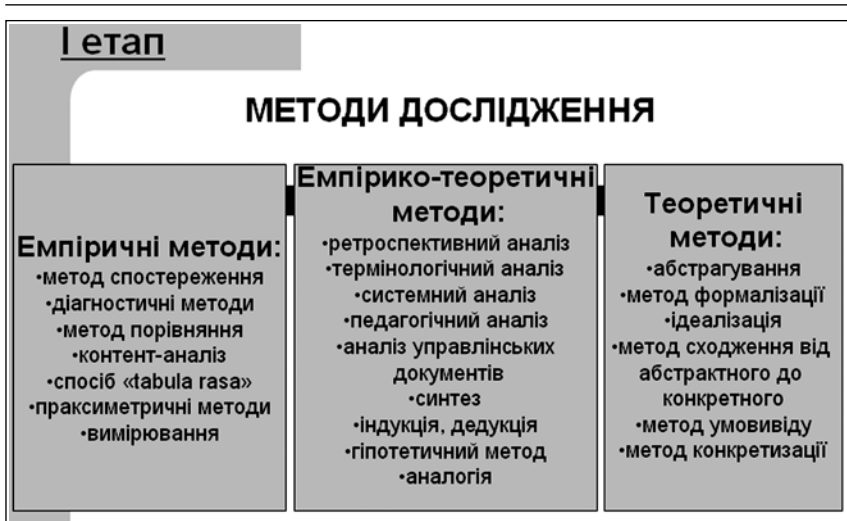
Рис. 2. Методи дослідження феномену культури на I етапі науково-дослідної роботи

Добір методів насамперед залежить від суб'єкта-дослідника як носія наукової культури, який має організувати, спланувати та провести розвідку з означеної вище проблематики та визначити сформованість субкультури і компетентність суб'єкта-керівника як респондента задля досягнення мети дослідження. Цей процес добору методів пов'язаний з процесами управління та самоуправління, організації та самоорганізації тобто синергії цих процесів.