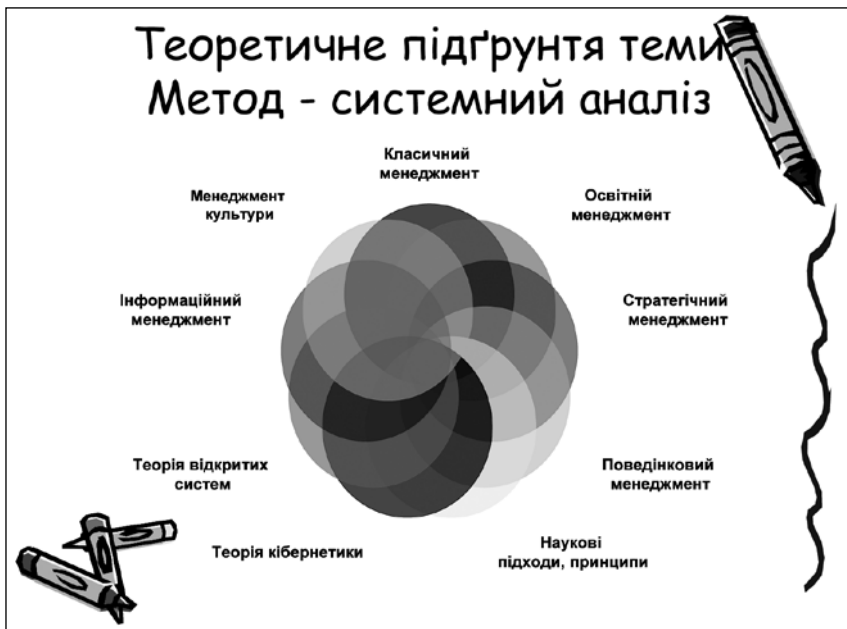
Рис. 4. Теоретичні засади дослідження феномену культури в управлінській діяльності сучасного керівника

ходів для їхнього аналізу, у рамках яких виникло і сформоване уявлення про цей цивілізаційний феномен та межі його застосування в науці і практиці, ретроспективи розвитку та наукового підґрунтя менеджменту культури (рис. 5).