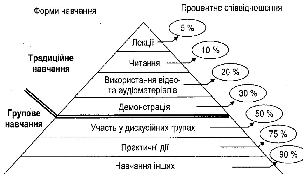
Рисунок 1. Піраміда навчання (Learning Pyramid)

Дослідження проведені у США в 1980-х роках ( National Training Laboratories in Bethel, Maine ) [4], дають можливість узагальнити дані щодо ефективності (середньоарифметичне значення проценту засвоєння знань) різних методів навчання дорослих. Ці результати представлені на схемі «Піраміда навчання» (рис. 1).