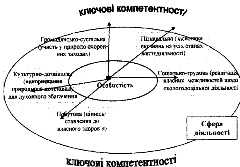
Рис. 1. Екологічна компонента у змісті ключових компетентностей

Отже, екологічна компетентність спеціаліста - це системна інтегративна якість особистості, яка визначається сукупністю здатностей вирішувати проблеми і завдання різного рівня складності, які виникають у побуті і професійній діяльності, на основі сформованого ціннісного ставлення до природи, знань, освітнього і життєвого досвіду, індивідуальних здібностей, потреб і мотивів.