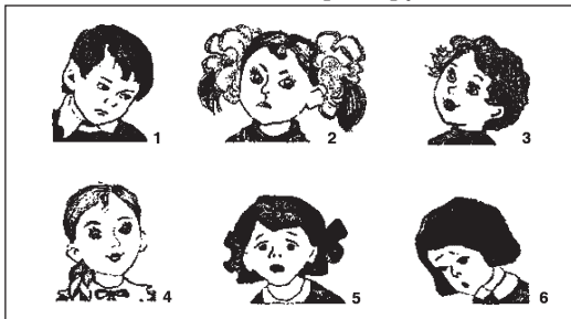
Мал. 1. 1. Образа 2. Злість 3. Здивування 4. Радість 5. Переляк 6. Смуток

Під час подальшого проведення гри вихователь наперед готує набір фотографій або ілюстрацій із зображенням людей (мал. 1), тварин (мал. 2), що знаходяться в різних емоційних станах. Спочатку дорослий пропонує придумати розповідь за однією картинкою (фотокарткою), потім початкова кількість поступово збільшується і викладається в різній послідовності у процесі розгортання сюжетної лінії. Надалі як опору для придумування розповідей вихователь може використовувати графічні моделі різних емоцій (мал. 3). Якщо кружечки приклеїти (або намалювати) на окремих кубиках, то з їхньою допомогою можна розігрувати і невеликі спектаклі.