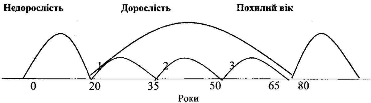
Рис. 1. Вікові періоди життя людини

Отже хронологія показує, що до категорії недорослих людей потрапляють і діти, і люди похилого віку, тобто ті, хто знаходяться на початку й в кінці життєвого шляху. Таким чином, маємо циклічний підхід до аналізу людського життя та її вікового становлення, де дорослість посідає центральне положення.