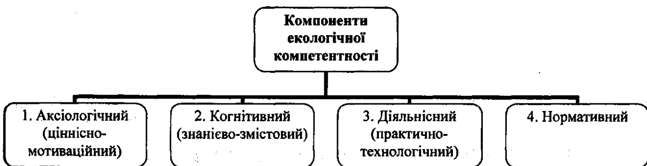
Рис. 3. Структурні компоненти екологічної компетентності фахівця

Виходячи із функцій, які покладаються на екологічну компетентність її складовими компонентами є: аксіологічний (ціннісно-мотиваційний); когнітивний (знанієво-змістовий); діяльнісний (практично-технологічний); нормативний. Кожний із компонентів вибирає сукупність значень, які наповнені конкретним професійним (навчально-предметним), виховним, комунікативним, ціннісно значимим змістом (рис. 3).