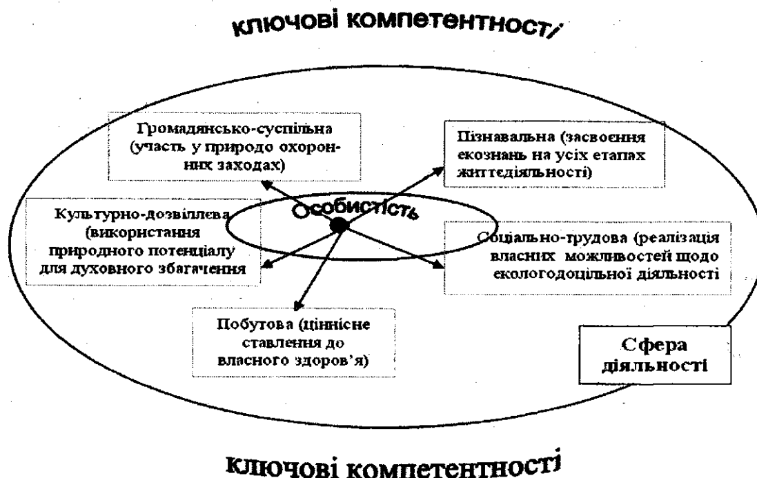
Рис. 1. Екологічна компонента у змісті ключових компетентностей

професійним групам, діяльність яких суттєво впливає на довкілля, або тих, хто безпосередньо займається природоохоронною діяльністю [6]. Її брати до уваги два види екологічної компетентності – повсякденно-побутову (виявляється у повсякденному житті) і професійну (характеризує людину як суб'єкта професійної діяльності, її здатність успішно виконувати свої повноваження) [5].