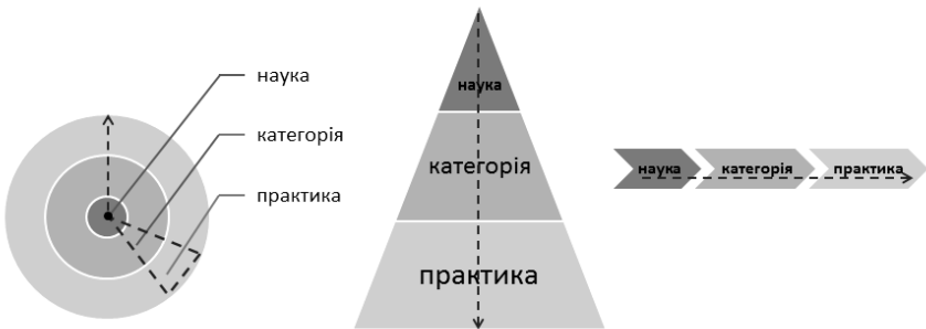
Рис. 3. Лінійний взаємозв'язок семантичних полів “наука”, “категорія” та “практики”

Аби чіткіше схопити, що ми розуміємо під практикою як гіпертекстуальним або мережевим принципом організації мовлення, котрий саморепродукується в текстуальних конфігураціях різного рівня, змодельюємо альтернативний мережевому лінійний спосіб взаємозв'язків для цієї ж множинності компонентів – реконструюємо організацію іншої практики як правила (рис. 3).