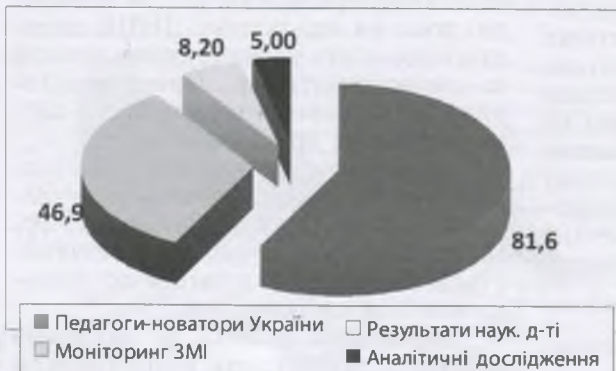
Діаграма 2. Рейтинг інформаційно-аналітичних рубрик веб-порталу ДНПБ України ім. В. О. Сухомлинського серед віддалених користувачів за 2013 р. (у відсотках)

Схарактеризувавши змістовне наповнення аналізованих розділів веб-порталу ДНПБ України ім. В. О. Сухомлинського, виявили, що найвищий рейтинг має рубрика „Педагоги-новатори України” (81,6%). Сторінка „Моніторинг ЗМІ з питань