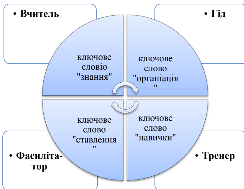
Рис.2. Провідні ролі педагога-андрагога

Названі компетенції вимагаються для виконання провідних ролей педагога-андрагога, які є взаємопов'язаними, взаємодоповнюваними і взаємозалежними (рис. 2).