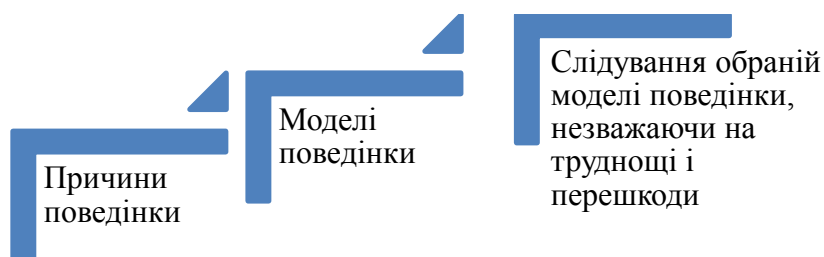
Рис. 1. Мотивація дорослої людини 8

Схематично мотивацію можна представити так (рис. 1):