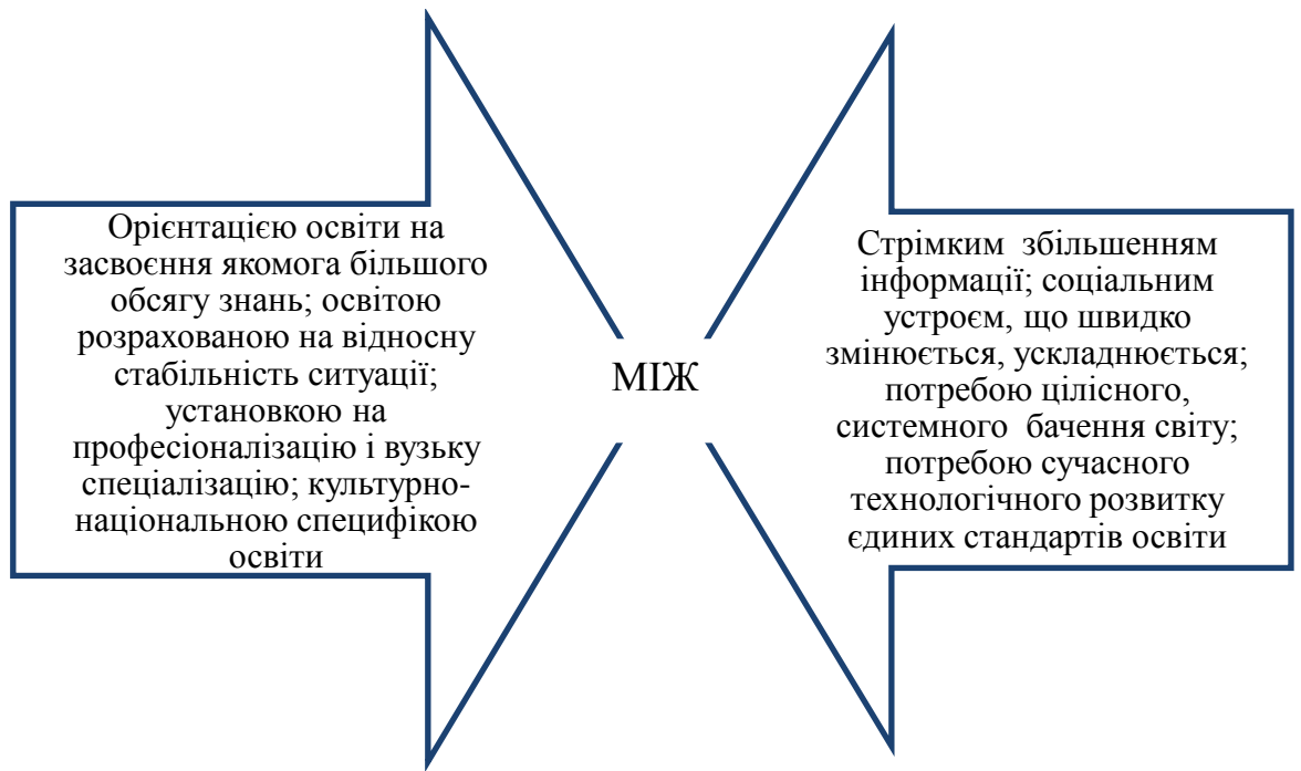
Рис. 1. Значення освіти дорослих у розв’язанні сукупності суперечностей

З урахуванням сучасної соціально-економічної ситуації України можна виокремити додаткові суперечності між: інтенсивно змінюваними умовами життя в країні й недостатньою здатністю дорослої людини успішно адаптуватися до нової ідеологічної й соціокультурної ситуації; задекларованим визнанням ключової ролі освіти у суспільстві, що дає їй підстави посісти провідні позиції в культурі, визначати перспективи розвитку країни та ігноруванням випереджувальної функції освіти в суспільстві; об’єктивним підвищенням ролі освіти дорослих, її впливом на соціально-економічні процеси та відсутністю юридичного, фінансового й науково-методичного забезпечення.