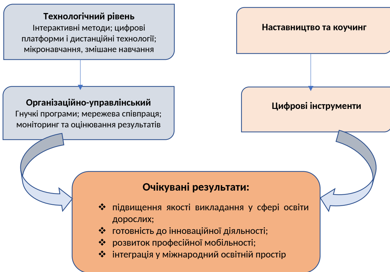
Рис 2. Модель методологічних орієнтирів використання інноваційних стратегій для підготовки викладачів у післядипломній освіті