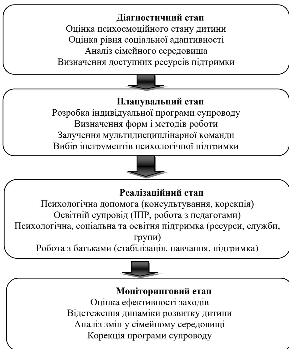
Рис. 2. Етапи реалізації системи психологічного супроводу родин військовослужбовців

Реалізація розробки має поетапний характер – рис. 2.