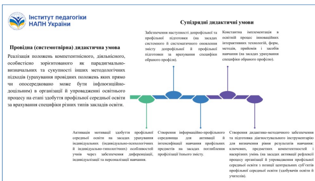
Рис. 2. Дидактичні умови впровадження дидактичних систем профільної середньої освіти

Визначено дидактичні умови впровадження дидактичних систем профільної середньої освіти (рис. 2), а саме: