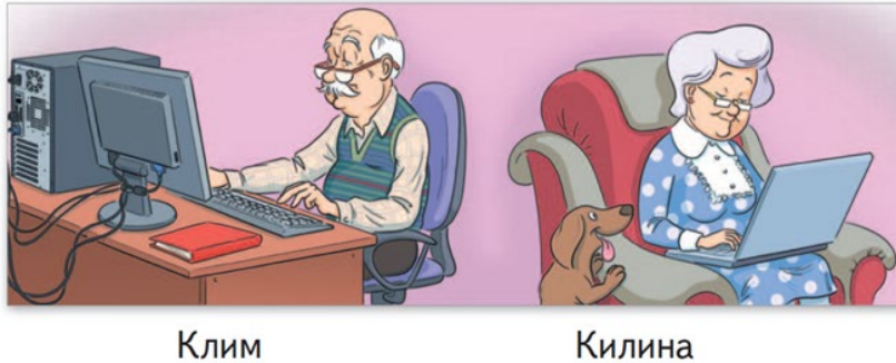
Рис. 2. Візуалізація образу старшого покоління у сучасному цифровому контексті в змісті підручника (Вашуленко М. & Вашуленко О., 2018а, с. 72)

Зображення дідуся Клима та бабусі Килини як активних користувачів комп'ютерної техніки (настільного ПК та ноутбука) закладає основи гендерної рівності як норми демократичного соціуму.