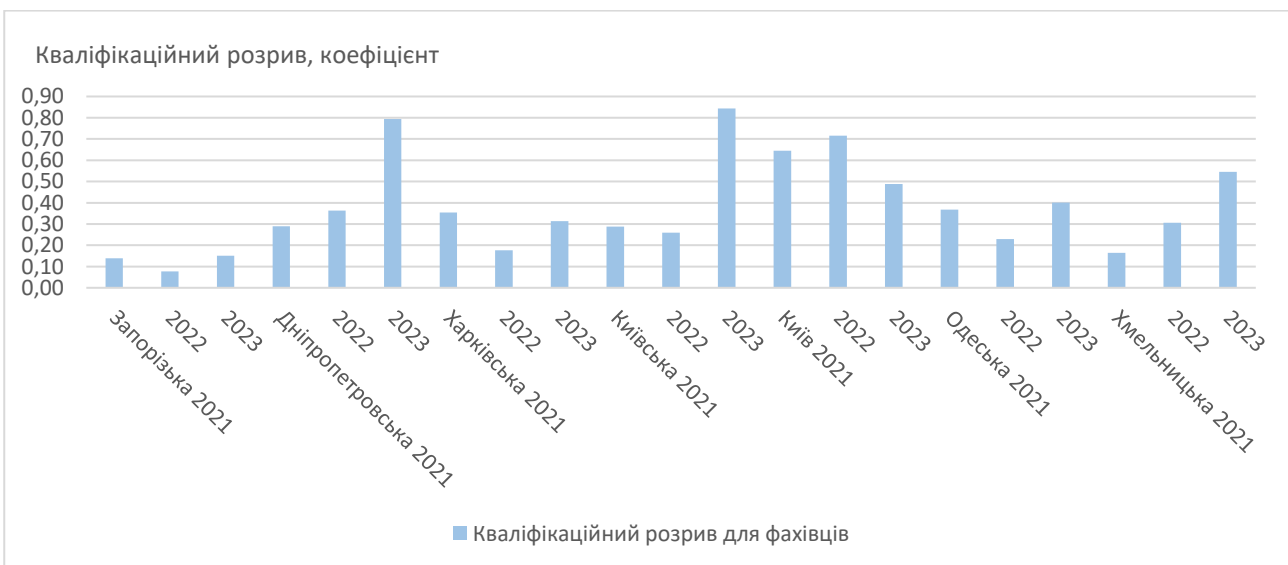
Рис. 3 Кваліфікаційний розрив на ринку праці України для фахівців