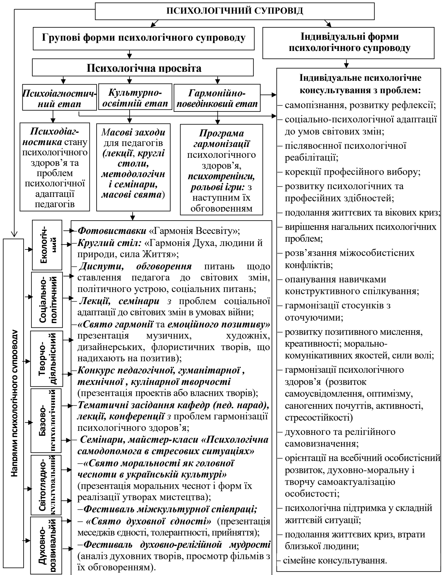
Рис. 1 . Структура психологічного супроводу професійної діяльності педагогічних