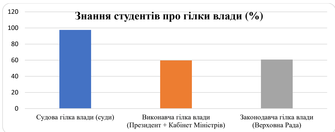
Рис. 1. Рівень обізнаності студентів щодо належності органів державної влади до відповідних гілок влади (за результатами авторського опитування, n = 79)

Результати опитування засвідчили нерівномірний рівень сформованості базових політико-правових знань студентів. Зокрема, правильну відповідь щодо форми державного правління України як парламентсько-президентської республіки надали 63 респонденти (79,7%), тоді як інші учасники опитування обрали варіанти «президентсько-парламентська республіка» (13,9%), «парламентська республіка» (2,5%), «республіка» (1,3%), «президентська республіка» (1,3%) та навіть «абсолютна монархія» (1,3%).