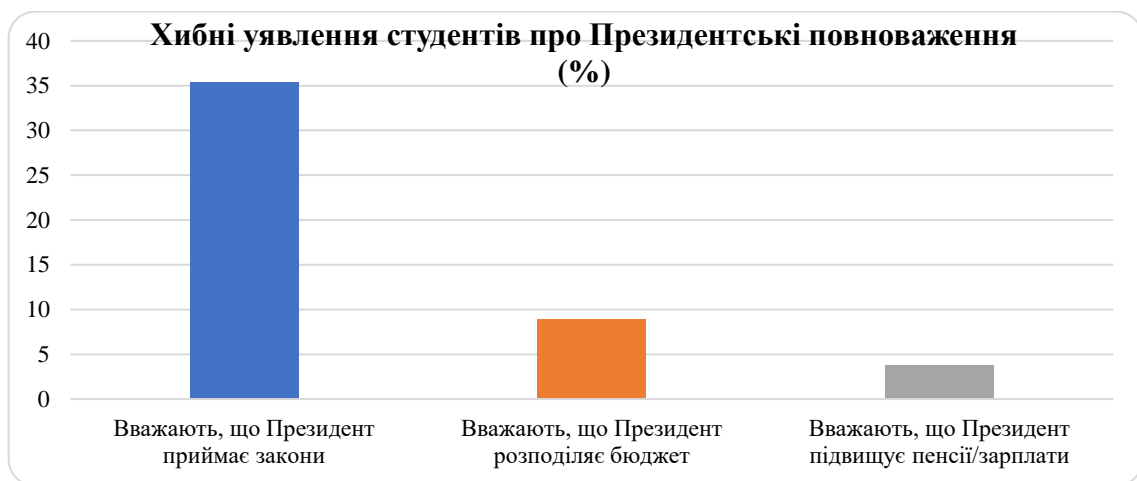
Рис. 2. Помилкові уявлення студентів щодо повноважень Президента України (за результатами авторського опитування, n = 79)

Особливу увагу привертають результати, що відображають помилкові уявлення студентів щодо повноважень Президента України.