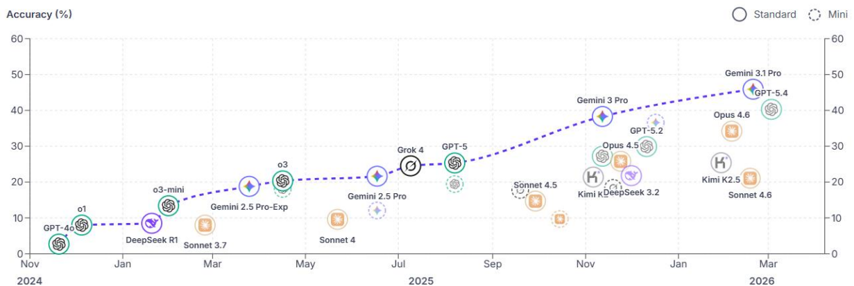
Рис. 1. Програм ШІ за версією Humanity's Last Exam ( https://lastexam.ai )

З появою численних інструментів штучного інтелекту (ШІ) (Рис. 1), включаючи останнім часом швидко поширювані інструменти генеративного ШІ (ГенШІ), виникає проблема доцільного їх використання у науково-педагогічній діяльності, зокрема для проведення освітніх досліджень; які їх функції та можливості є корисними, які наявні обмеження.