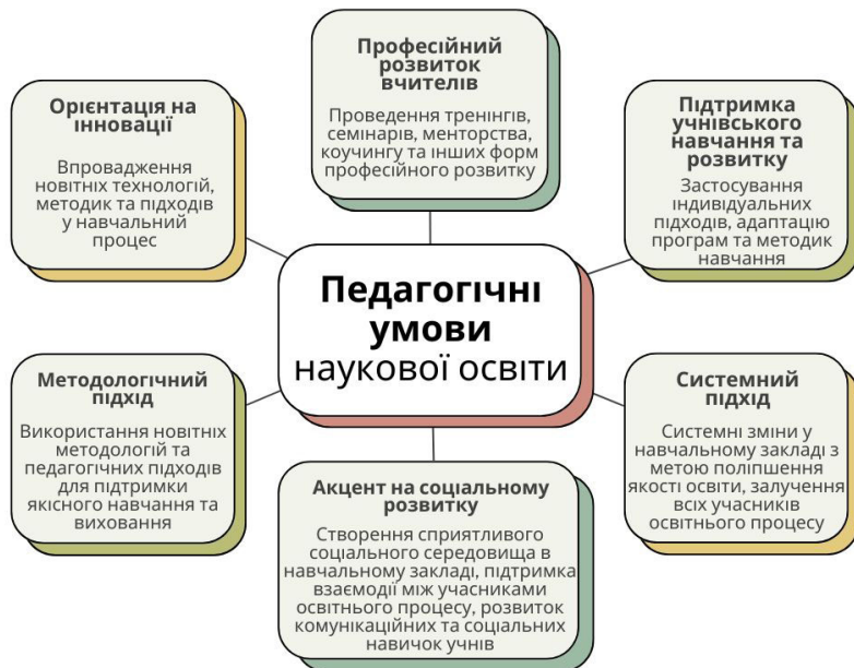
Рис. 1.3. Педагогічні умови наукової освіти

Методологічний підхід до наукової освіти охоплює чітку постановку цілей навчання, вибір відповідних віку та знанням учнів методів дослідження, формування в них критичного мислення, аналітичних здібностей і здатності до самостійного пошуку інформації. Важливим компонентом є створення такого навчального середовища, яке стимулює інтерес до наукової діяльності та сприяє співпраці. Регулярна оцінка прогресу учнів та надання зворотного зв'язку допомагають коригувати навчальний процес і забезпечують його ефективність.