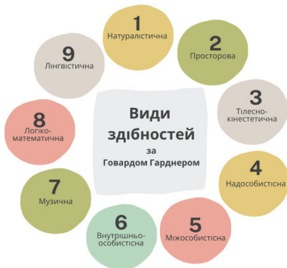
Рис. 1.2. Суміжні здібності в «множинному інтелекті» обдарованої особистості

– міжвідомча співпраця, що забезпечує залучення фахівців із різних сфер (медицина, психологія, соціальна робота тощо) для надання комплексної допомоги учню [1].