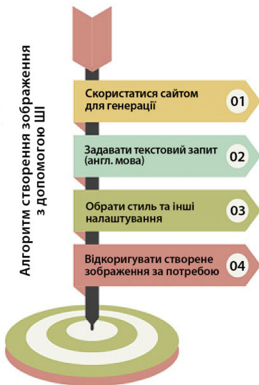
Рис 2.4. Алгоритм створення зображення з допомогою ШІ

Штучний інтелект працює на основі алгоритмів, які дають йому змогу виконувати певні завдання. Одним із підходів є генеративні моделі, які використовують глибокі нейронні мережі, щоб згенерувати нові зображення, що відповідають певному запиту. Такі моделі використовуються, наприклад, для створення нових зображень, які не існували раніше, або для зміни характеристик наявних зображень (наприклад, зміни кольору, форми тощо). Для навчання таких моделей використовуються набори даних із реальних зображень, які система використовує для навчання глибоких нейронних мереж (рис. 2.4).