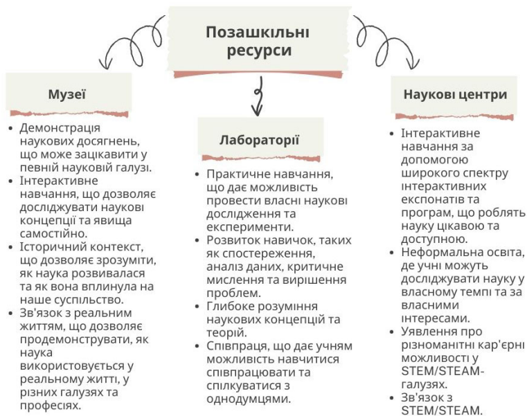
Рис. 2.1. Особливості освітніх послуг із наукової освіти окремих позашкільних ресурсів

до наукової спільноти та розвиваючи критичне мислення. Вони пропонують інтерактивний доступ до експонатів, дослідницькі проекти, лекції, семінари та інші заходи, що розширюють знання учнів у різних наукових галузях, дають їм можливість досліджувати та застосовувати наукові концепції на практиці, а також ознайомитися з роботою вчених.