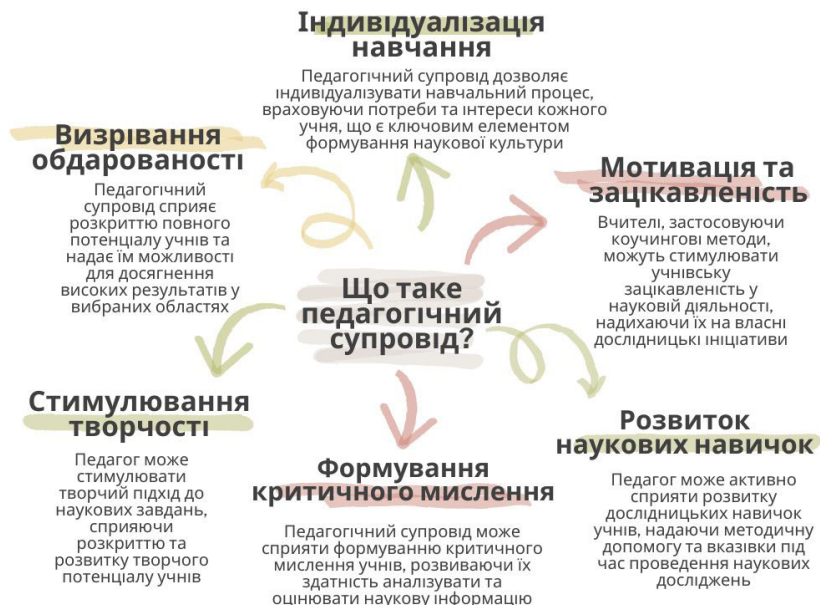
Рис. 1.1. Педагогічний супровід і результати його впливу на здобувачів наукової освіти

Психолого-педагогічний супровід (ППС) можна розглядати як інтегративну освітню технологію підтримки обдарованих здобувачів наукової освіти. ППС – це систематичний процес, що спрямований на створення оптимальних умов для особистісного розвитку здобувачів наукової освіти, який полягає в технологічно збалансованій, комплексній підтримці їхньої навчальної та науково-дослідницької діяльності, розвитку у здобувачів здібностей, наукового мислення, дослідницьких навичок, творчого потенціалу, самореалізації та соціальної адаптації (рис. 1.1).