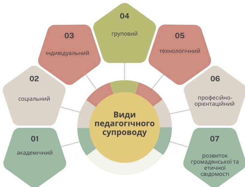
Рис. 1.2. Види педагогічного супроводу

Основні види педагогічного супроводу здобувачів наукової освіти можуть охоплювати академічний, соціальний, індивідуальний, груповий, технологічний, професійно-орієнтаційний супроводи, а також супровід, що пов'язаний із розвитком громадянської та етичної свідомості (рис. 1.2).