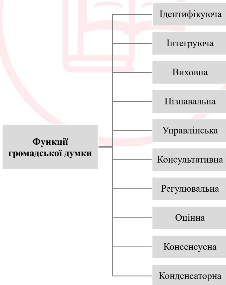
Рис. 2. Функціональні характеристики громадської думки

Структуру громадської думки, для усебічного розгляду цього феномену, варто доповнити функціональними характеристиками. У літературних джерелах йдеться про такі основні функції громадської думки у соціальному середовищі: ідентифікуюча – уподібнення, асимілювання соціального суб'єкта з іншими; інтегруюча – об'єднання соціальних суб'єктів; виховна – успадкування засобів та способів діяльності, трансляція, фіксація і передача життєвого досвіду; пізнавальна – інформування, зміна, оновлення знань про особливості функціонування суспільства; управлінська – організація взаємодії громадян і органів влади; консультативна – продукування підходів до розв'язання соціальних проблем; регулювальна – генерування цінностей, норм, традицій, що регулюють активність соціальних суб'єктів; оцінна – артикуляція оцінних суджень суб'єктами соціального буття; консенсусна – формування порозуміння між соціальними суб'єктами; конденсаторна – вироблення ідей, думок, що закріплюються в законодавчих актах (див. рис. 2).