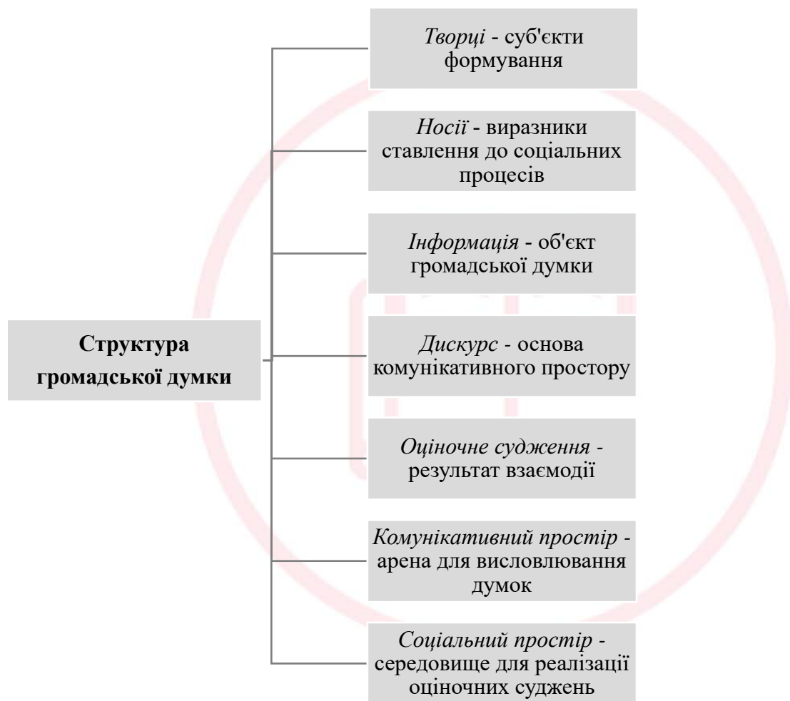
Рис. 1. Основні структурні елементи громадської думки

Для подальшого дослідження функціонування громадської думки в системі «сім'я-школа» важливим є окреслення основних компонентів – структурних елементів громадської думки (див. рис. 1).