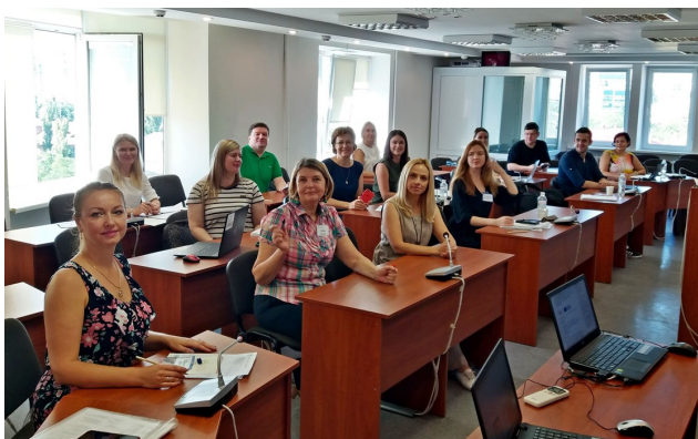
Тренінг для учасників Проекту, серпень 2020 р.

Цільовими групами Проекту є студенти та персонал переміщених університетів, місцеві громади і бізнес Донецької та Луганської областей.