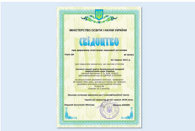
Свідоцтво про державну атестацію Інституту вищої освіти НАПН України, 2021 р.

За результатами проведеної у 2021 р. державної атестації наукових установ інститут віднесено до I класифікаційної групи.