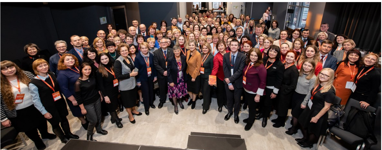
Україно-британський форум «Досконалість викладання і навчання у вищій освіті», грудень 2019 р.

Завдання Проєкту — сприяти модернізації систем вищої освіти в програмних країнах шляхом запровадження національних центрів сертифікації викладачів для просування європейських освітніх інновацій шляхом сертифікації професійних університетських викладачів.