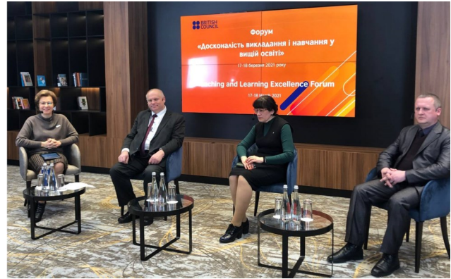
Україно-британський форум «Досконалість викладання і навчання у вищій освіті», березень 2021 р.

Інститут є співорганізатором Україно-британського форуму «Досконалість викладання і навчання у вищій освіті» та Міжнародної конференції «Європейська інтеграція вищої освіти України у контексті Болонського процесу», під час яких за участю провідних українських і міжнародних фахівців обговорюються такі актуальні питання: досконалість викладання та шляхи її досягнення, професійний розвиток викладачів університету, баланс зусиль університету і викладачів, взаємодія між студентами та викладачами, трансформація викладання, студентоорієнтоване викладання і його особливості, досвід Великої Британії та України щодо вдосконалення викладання у вищій освіті, забезпечення та вдосконалення якості вищої освіти, сучасні підходи та інструменти оцінювання й вимірювання якості діяльності закладів вищої освіти у світлі тенденцій та пріоритетів розвитку Європейського простору вищої освіти (Калашнікова, 2019; Калашнікова, 2021а; Калашнікова, 2021b).