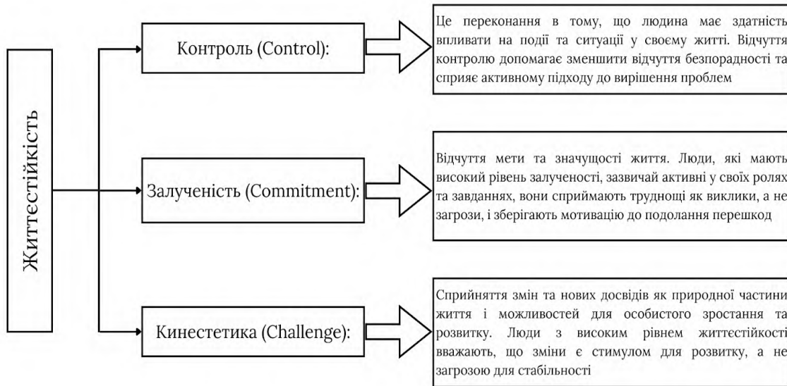
Рис. 1. Основні компоненти поняття життєстійкості

Багато досліджень свідчать про те, що відчуття контролю над власним життям є одним з ключових компонентів життєстійкості. Індивіди, які відчують, що вони можуть впливати на хід подій, більш схильні до позитивного мислення, ефективного вирішення проблем та адаптації до стресів [1].