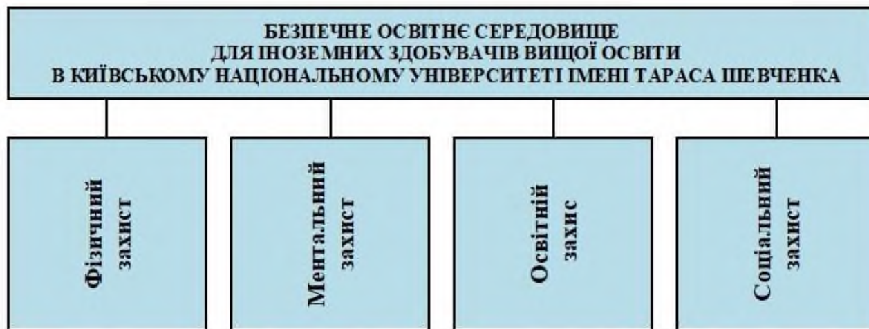
Рис. 1. Безпечне освітнє середовище як інформаційно-освітня потреба іноземних здобувачів вищої освіти в Київському національному університеті імені Тараса Шевченка

Враховуючи умови воєнного часу в Україні, безпечне освітнє середовище – це центральна складова забезпечення освітнього процесу закладу освіти. В Київському національному університеті імені Тараса Шевченка створюються умови для створення безпечного освітнього середовища для здобувачів вищої освіти, а тому числі, для іноземних здобувачів вищої освіти.