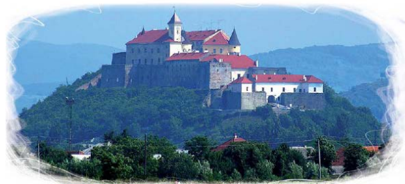
Замок у місті Мукачеві (сучасна світлина)