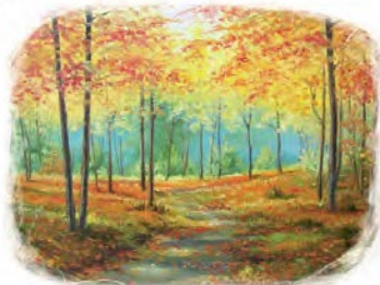
Тарас Приступа. Осіння стежина