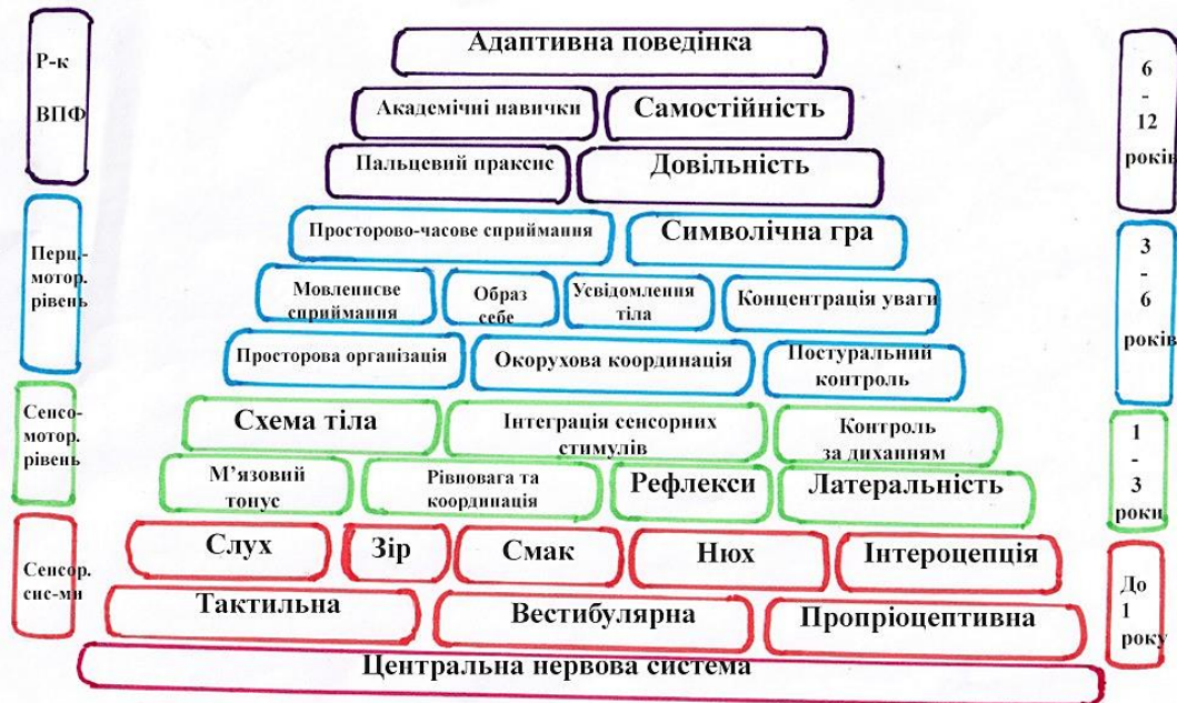
Рис. 1. Модель поетапного розвитку вищих психічних функцій людини Лазаро та Беруззо

Для роботи з дітьми з особливостями фонетико-фонематичної сторони мовлення – формування та розвиток: