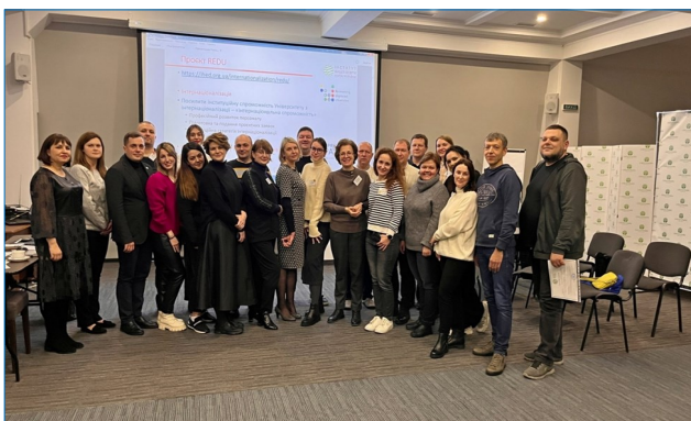
Тренінг «Інтернаціоналізація вищої освіти», 12-13 грудня 2022 р., м. Трускавець

Проект Британської Ради в Україні «Програма вдосконалення викладання у вищій освіті» ( https://ihed.org.ua/internationalization/tehe_ukraine/ ) (2019-2022 роки). Проведено 9 тренінгів з впровадження парадигми вдосконалення викладання для науково-педагогічних працівників 10 університетів України (40 учасників) (Інститут вищої освіти НАПН України, 2020d).