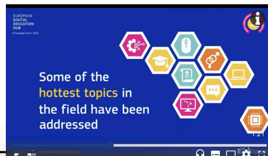
Рис.1. Європейський Цифровий Освітній Хаб, https://education.ec.europa.eu

Більше 3000 членів онлайн спільноти хабу, серед яких освітяни та всі зацікавлені сторони, ініціюють та беруть участь у широкому спектрі заходів, а саме: тематичних групах, що сприяє навчанню однолітків, очних та онлайн семінарах, присвячених міжгалузевому співробітництву; програмах наставництва; навчанні однолітків, заснованих на кращих освітніх практиках та ін. Орієнтація на користувача в Європейському Цифровому Освітньому хабі прокладає шлях до більш стійкої, стабільної та інклюзивної освіти та професійної підготовки в Європі.