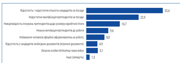
Рис. 2. Дані звіту «Ринок праці в Україні 2022-2023. Стан, тенденції та перспективи»

Приватний сектор має конкретну потребу у висококваліфікованих фахівцях (рис.2).