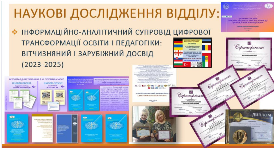
Рис. 2. Основний науковий доробок співробітників ВНІАСО за 2023 р.