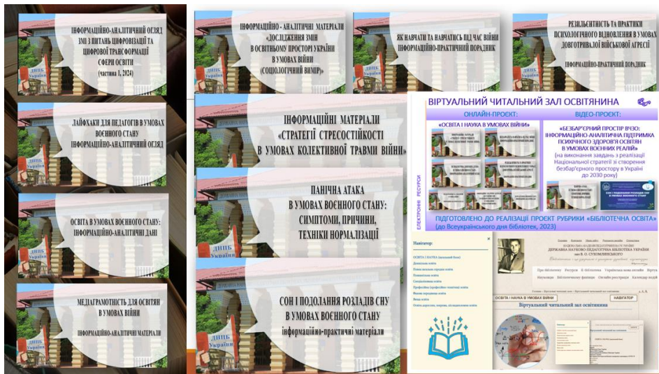
Рис. 3. Електронні ресурси: інформаційно-аналітичні огляди у контексті наукових досліджень ВНІАСО (2023 рік)