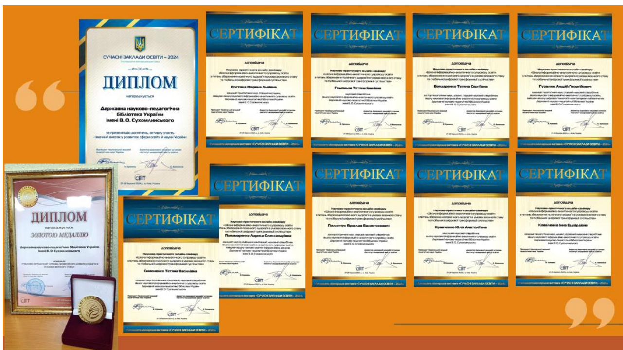
Рис. 8. Виставкова сертифікація виконавців наукових досліджень ВНІАСО (2024 р.)

з питань освіти і науки через застосування наукових підходів, проведення бібліометричних досліджень, сприяння розвитку й удосконаленню науково-методичних та організаційних засад інформаційно-аналітичного забезпечення педагогіки, психології й освіти, формування електронних ресурсів веб-порталу Бібліотеки в межах компетенції відділу, надання методичної та практичної допомоги фахівцям освітянських бібліотек у створенні аналітичної інформації з урахуванням інноваційних технологій, упровадження в практику і моніторинг упровадження в практику освіти результатів дослідження, участь у міжнародних наукових конференціях, семінарах, конкурсах, виставках, інших масових заходах; публікація у зарубіжних наукових виданнях результатів досліджень, які не є конфіденційною інформацією тощо (рис. 8).