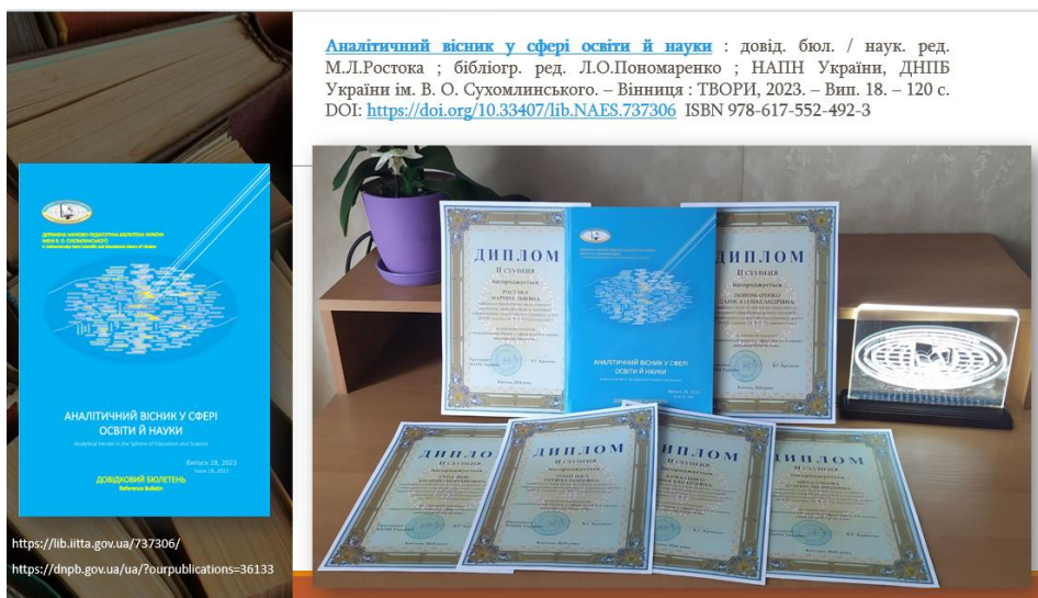
Рис. 4. Конкурсна перемога виконавців наукового дослідження ВНІАСО (2023-2024 рр.)