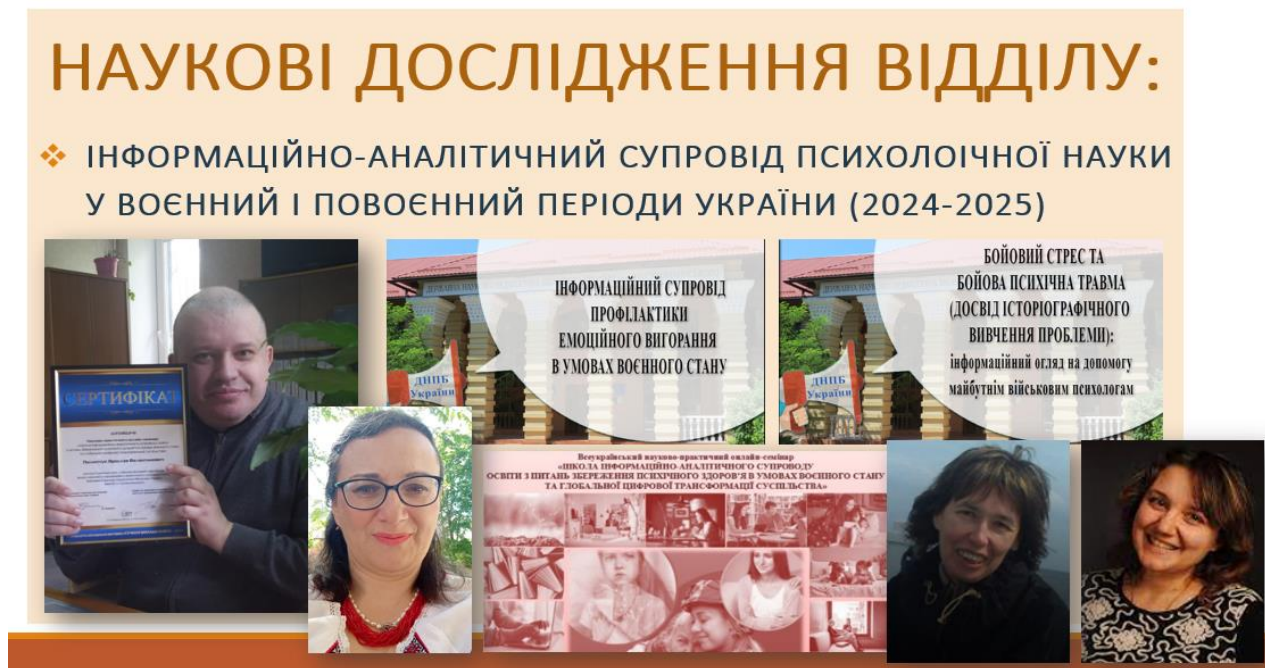
Рис. 6. Дослідницька діяльність виконавців наукового дослідження ВНІАСО (2024 рр.)

3. Констатувальний етап зазначеного вище наукового дослідження уможливив новий вектор діяльності ВНІАСО – прикладне наукове дослідження «Інформаційно-аналітичний супровід психологічної науки у воєнний та повоєнний періоди» (2024–2025) (керівник наукового дослідження – І. Е. Коваленко) [ 5 ], у ході якого розпочався теоретико-аналітичний етап дослідницького пошуку та отримано поточні прикладні результати (рис. 6).