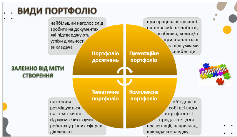
Рис. 1. Види е-портфоліо залежно від мети створення

Залежно від мети створення розрізняють такі портфоліо (рис. 1):