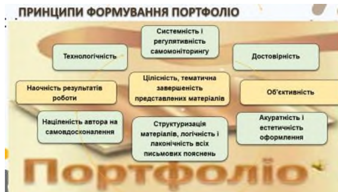
Рис. 4. Принципи і е-портфоліо

Підходи до проектування е-портфоліо: системний, компетентнісний, діяльнісний, акмеологічний (рис. 5).