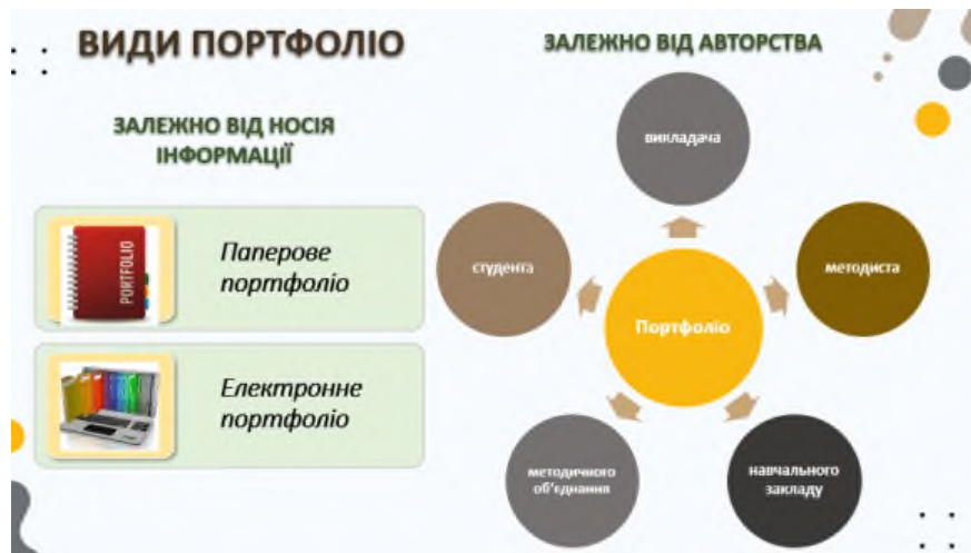
Рис. 2. Види е-портфоліо залежно від носія інформації та авторства

Функції портфоліо: діагностична – фіксує зміни і зростання профмайстерності за певний проміжок часу; мотиваційна – заохочує до ефективної роботи; змістова – розкриває весь спектр виконуваних робіт; розвивальна – забезпечує безперервність процесу зростання; цілепокладання – підтримує мету самовдосконалення; рейтингова – демонструє діапазон професійних компетентностей (рис. 3).