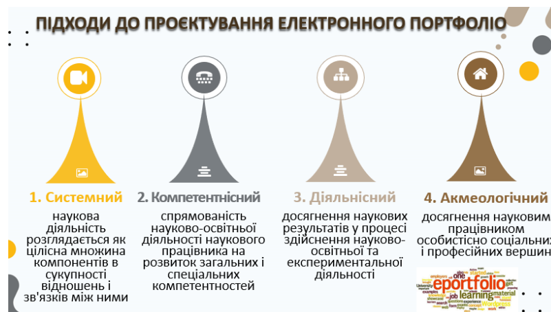
Рис. 5. Підходи до проектування е-портфоліо

Підходи до проектування е-портфоліо: системний, компетентнісний, діяльнісний, акмеологічний (рис. 5).