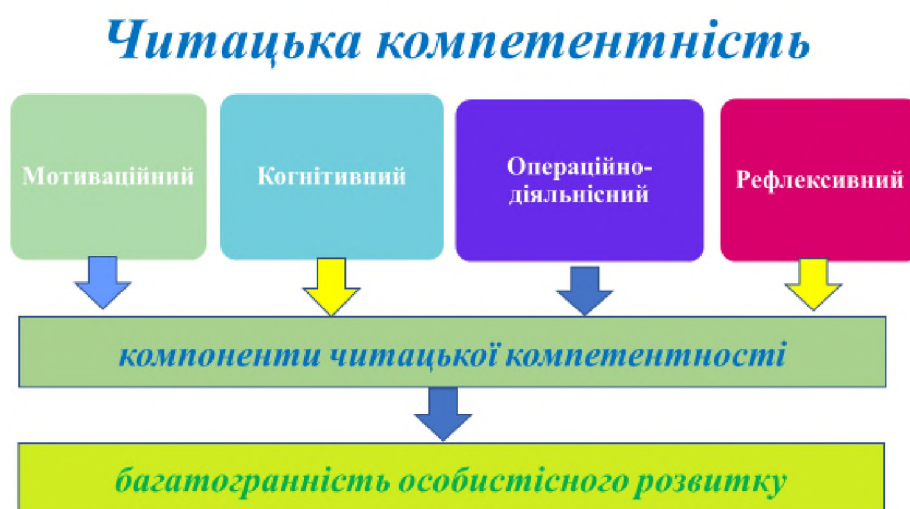
Рис. 1. Структура читацької компетентності

Читацька компетентність неможлива без мотиваційних потреб здобувачів освіти, когнітивного (знаннєвого), операційно-діяльнісного, рефлексивного складників. Чи не найважливіше значення має розвиток компонентів ціннісно-сислової та емоційно-вольової сфер особистості учня. Структуру читацької компетентності представлено на рис. 1.