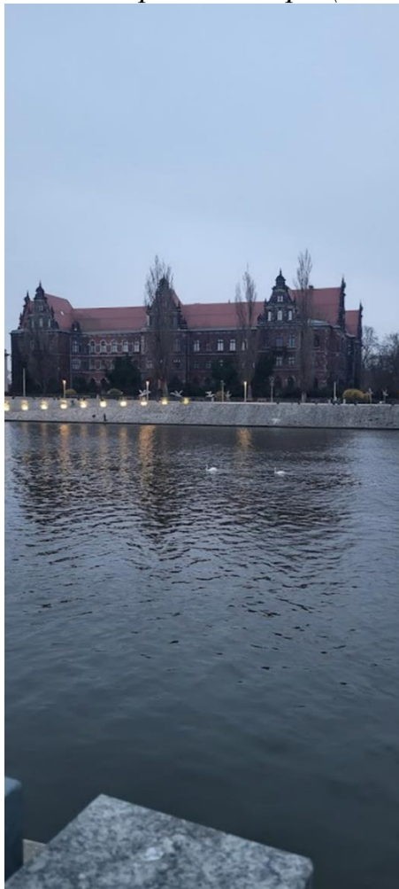
Річка Одра.*

«2. Рельєф. Рівнини, долини, є річка – Одра (див. фото)».