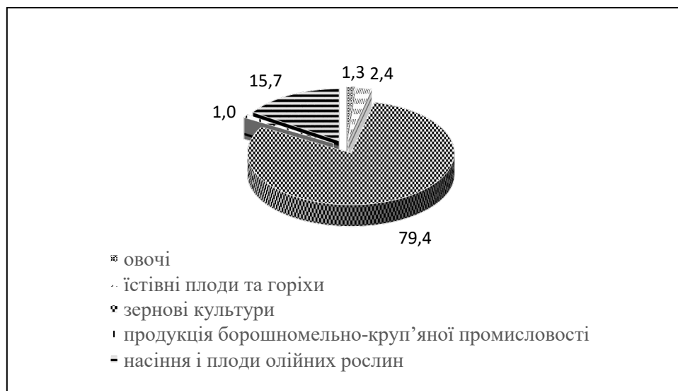
Рис. 2. Структура експорту товарної групи «Продукти рослинного походження» у 2021 році

На товарну групу «Продукти рослинного походження» припадала майже четверта частина всього експорту. Значну частку цієї групи традиційно становив експорт зернових культур (79,4 % у 2021 р.) та насіння і плодів олійних рослин (15,7 % у 2021 р.) (рис. 2).