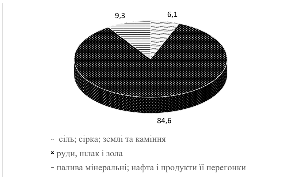
Рис. 3. Структура експорту товарної групи «Мінеральні продукти» у 2021 році

Понад 9 % обсягу експорту продуктів цієї групи припадало на підгрупу «Мінеральні палива, нафта і нафтопродукти».