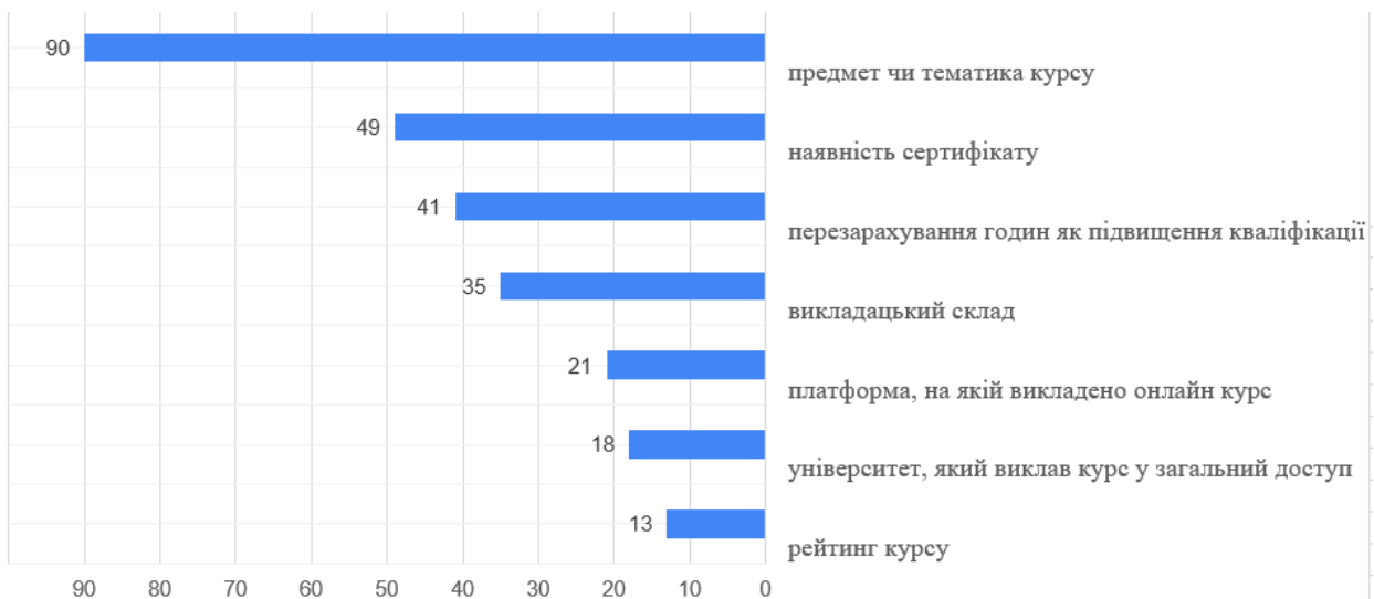
Рис.3. Критерії обрання курсу МООМ (107 відповідей)

Критерії, якими керувалися здобувачі при обранні того чи іншого курсу, подані на рисунку 3.