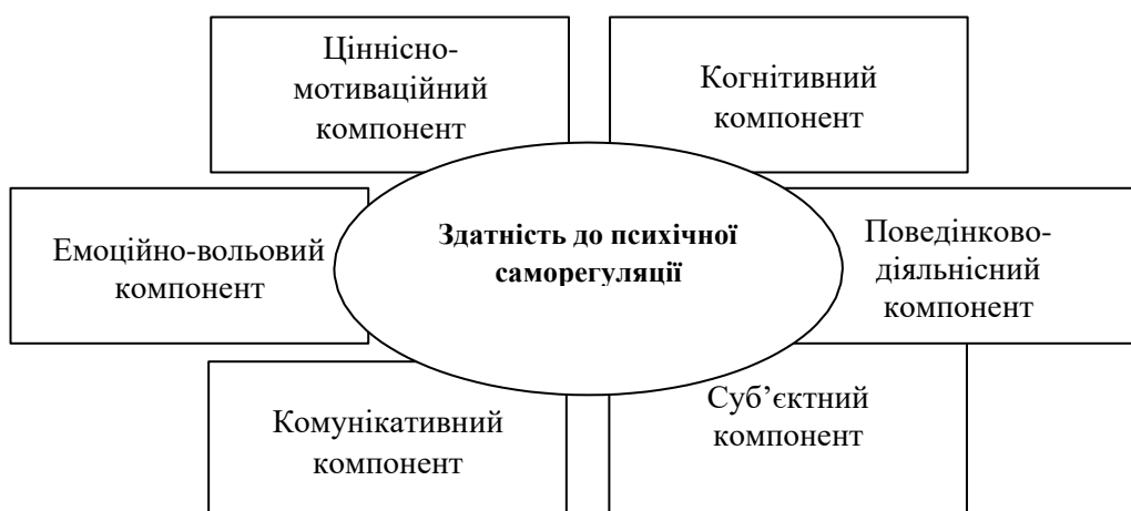
Рис. 1. 1. Структура здатності до психічної саморегуляції здобувачів освіти

Системний аналіз наукових підходів до феномена саморегуляції (В. Злагодух, О. Іванова, Л. Колесніченко, О. Макаревич, В. Олефір, Ю. Позіненко, О. Плотко, Н. Пов'якель, А. Порицький, Д. Чижма та ін.) і базових сфер особистісно-професійного розвитку фахівців, діяльність яких відбувається в особливих умовах – соціально-комунікативна, емоційно-вольова, мотиваційно-ціннісна, когнітивна і специфічна професійна компетентність (В. Лефтеров, дає підстави визначити структуру здатності до психічної саморегуляції здобувачів освіти як сукупність компонентів – ціннісно-мотиваційного, когнітивного, емоційно-вольового, поведінково-діяльнісного, комунікативного та суб'єктного: