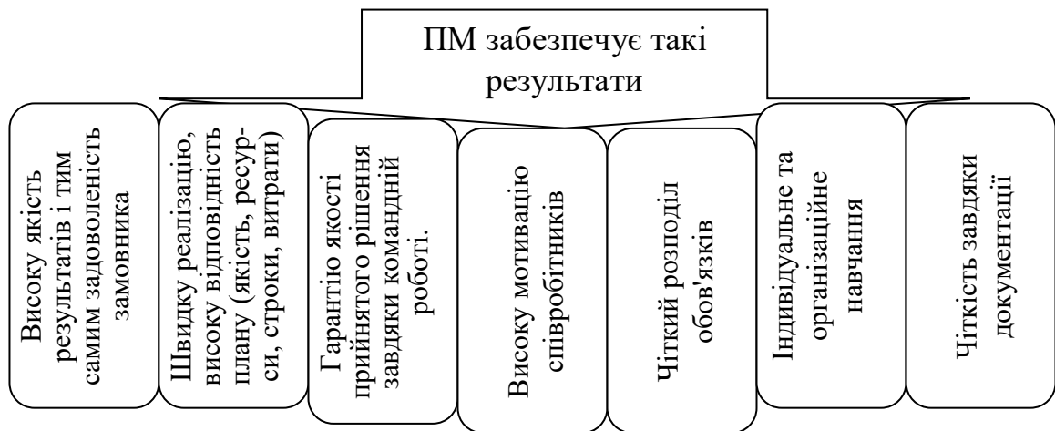
Рис.3. Чому саме проєктний менеджмент є відповіддю на виклики сьогодення

Теза: інноваційний розвиток освітньої організації (закладу освіти) має лінійну залежність від розвитку інноваційного потенціалу кожного учасника освітнього процесу, що забезпечується їх здатністю організувати свою діяльність як ПРОЄКТНУ .