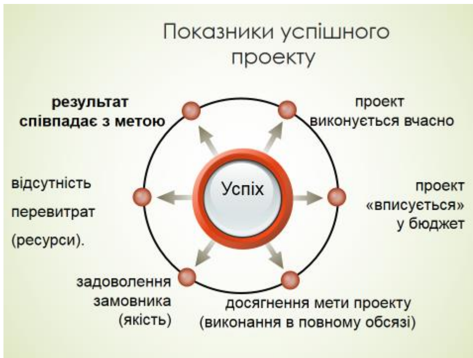
Рис. 6. Показники успішності реалізації інноваційного освітнього проекту

Зазначимо, що управління інноваційним розвитком освітньої організації є певним процесом цілеспрямованого принципово нового за формою впливу суб'єкта управління на об'єкт з метою забезпечення стійких позитивних змін в діяльності цієї організації, що приведуть до успішності її життєдіяльності і сприятиме конкурентоспроможності освітньої організації як на ринку праці так і на ринку освітніх послуг.