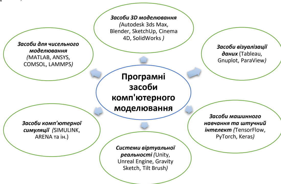
Рис. 1. Класифікація програмних засобів комп'ютерного моделювання

В нашому дослідженні було виконано систематизацію програмного забезпечення за галузями комп'ютерного моделювання та наведено приклади програмних засобів до кожної з груп (рис. 1).