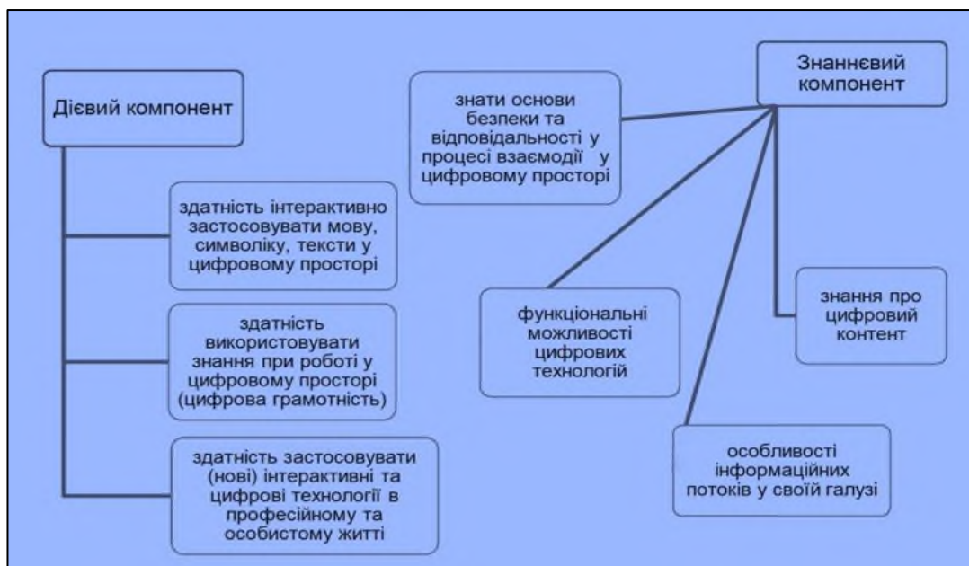
Рис. 1. Компоненти цифрової компетентності