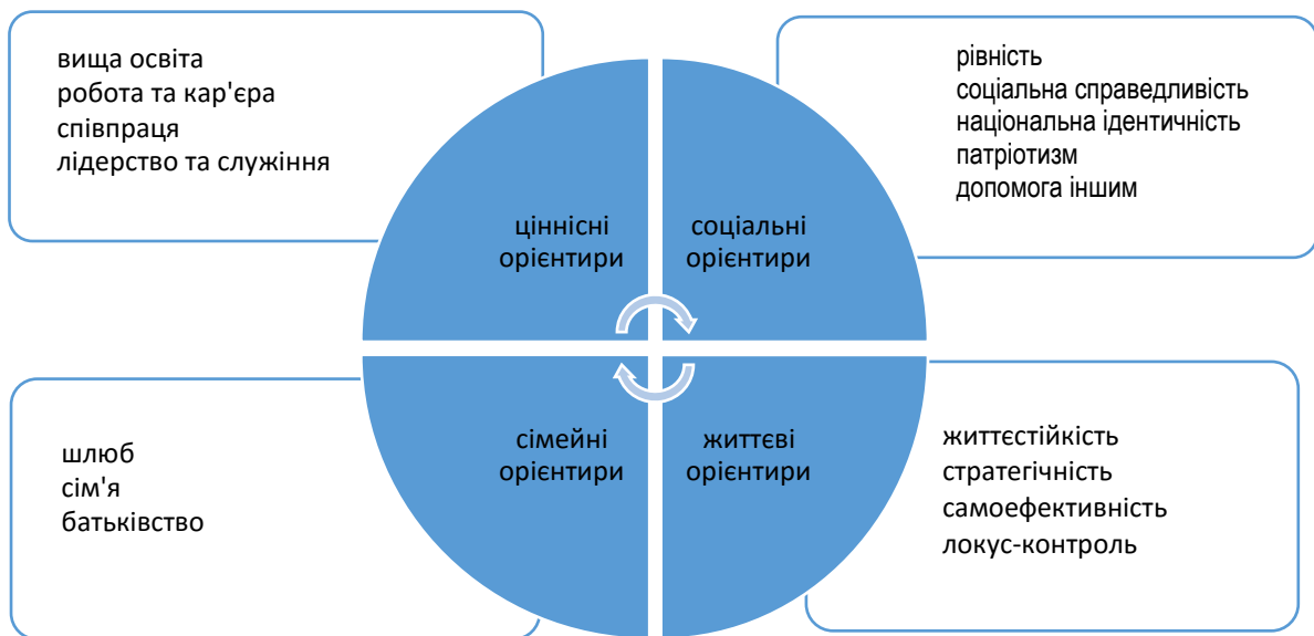
Рис. 1. Перспективні орієнтири формування соціальних очікувань учнівської молоді

Інформація, яка отримана шляхом сфокусованого групового інтерв'ю дозволяє підібрати інструментарій для подальшого кількісного дослідження проблеми соціальних очікувань та обрати раціональний шлях для вдосконалення й покращення соціально-педагогічної роботи в освітніх закладах, соціальних установах. При цьому посилення ефективності соціально-педагогічної роботи з підлітками та молоддю має відбуватися з урахуванням гендерного, середовищного та регіонального аспектів формування соціальних очікувань.