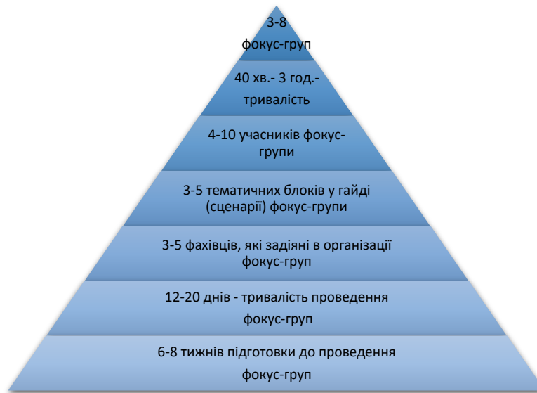
Рис. 4. Типові вимоги до організації фокус-груп

Тривалість процесу від шести до восьми тижнів залежить від факторів логістики, складності та терміновості проекту, доступності осіб, які приймають рішення, а також складності набору учасників [3].