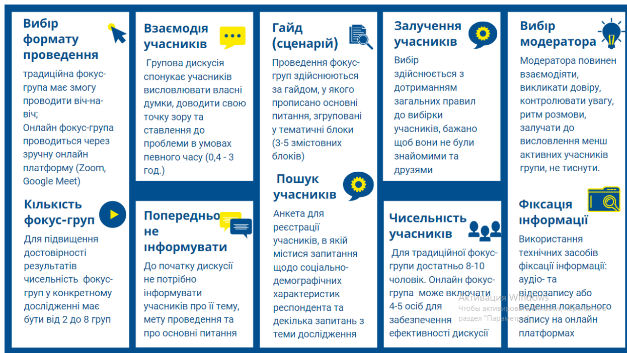
Рис. 3. Організаційно-методичні фактори успішності проведення фокус-груп

Успішність фокус-групового дослідження соціальних очікувань учнівської та студентської молоді цілком залежить від врахування організаційних та методичних факторів під час його проведення (рис. 3.).