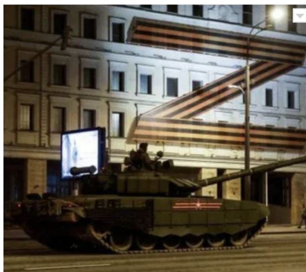
Фото 1. Символ рашизму на приміщенні у Москві під час репетиції параду до 9 травня 2022 року.

12. Розміщення російських військ у Республіці Білорусь та використання її території для нападу на Україну;