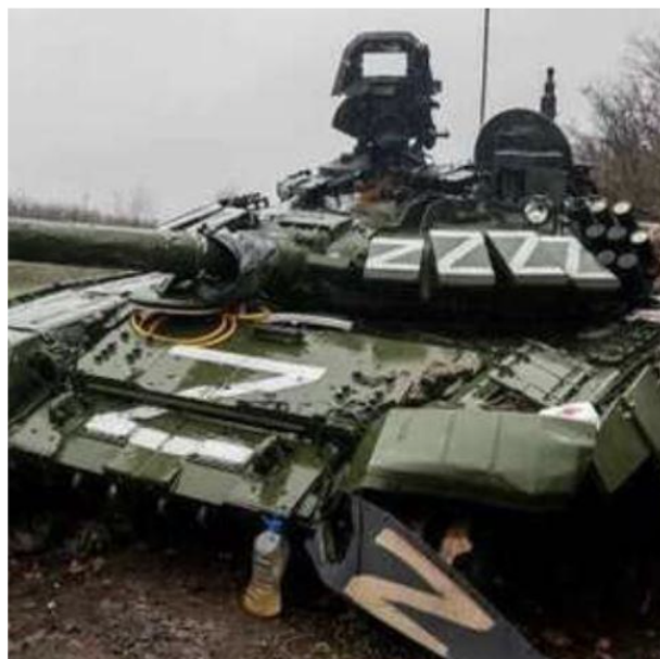
Фото 2. Символ рашизму на знищеному ворожому російському танку (весна 2022 року).

На нашому боці – правда. Тому ворог, з допомогою Божою та за підтримки всього цивілізованого світу, буде переможений.