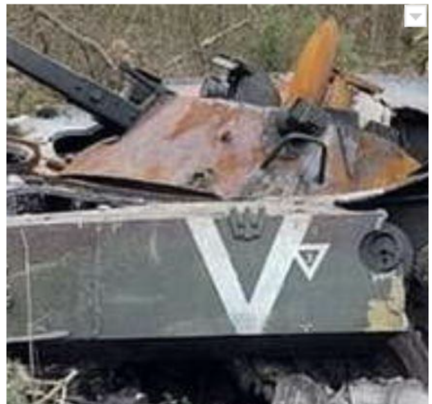
Фото 3. Символ рашизму на знищеній ворожій російській бойовій машині піхоти (весна 2022 року).

Представниками партій, владних структур та суспільних інституцій Російської Федерації, що за високу платню зголосилися обслуговувати рашистську політику диктатора В. Путіна були: голова Державної думи – В. Володін та депутати; голова Ради Федерації – В. Матвієнко; голова уряду – М. Мішустін та співробітники; міністр оборони – С. Шойгу та армія; голова Федеральної служби безпеки – О. Бортніков та працівники спецслужби; заступник голови Ради безпеки – Д. Медведєв; політичні партії і рухи; журналісти, представники культури і мистецтва тощо. У процесі реалізації рашиської політики значну роль відіграли підконтрольні Путіну олігархи, що сформували свій капітал завдячуючи йому. Вони оперативно використовували всі наявні ресурси за його прямим розпорядженням.