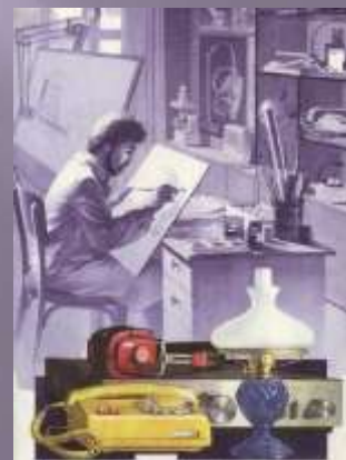
Промисловий дизайн (побутова техніка)