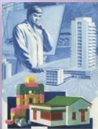
Архітектура, ландшафтний дизайн

Для вступу у вищі навчальні заклади дизайнерського спрямування і нині у абітурієнта має бути достатня художня підготовка з візуалізації, наявність документа про навчання в художній школі, школі мистецтв. Дивує, що вчителі, методисти образотворчого мистецтва і навіть науковці сфери мистецтва, а інколи і техніки та технології відносять дизайн до сфери мистецтва. Дизайн є першим художнім етапом розробки проєкту дизайнером (в радянський час – художником-конструктором), слідом за яким розробляється технічний проєкт інженером-конструктором, а тільки потім розробляється інженером-технологом технологія виготовлення серійного виробу для тиражування. В образотворчому мистецтві розглядаються тільки результати дизайнерських розробок за їх естетичними і художніми характеристиками і не навчають дизайнерському проєктуванню в колірно-графічному проєкті, в моделі або макеті із матеріалів. Навіть те ж радянське визначення – художник-конструктор (нині – дизайнер) свідчить про виробничу сферу, а не про мистецьку – образотворчу. Тільки після усунення означеної суперечності в підміні понять, ми зможемо повернути дизайн до належної для нього категорії сфери матеріального виробництва.