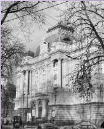
Львівський міський промисловий музей

Бібліографічне посилання: ЛЬВІВСЬКИЙ МІСЬКИЙ ПРОМИСЛОВИЙ МУЗЕЙ Федорова Л.Д. [Електронний ресурс] // Енциклопедія історії України: Т. 6: Ла-Мі / Редкол.: В. А. Смолій (голова) та ін. НАН України. Інститут історії України. - К.: В-во "Наукова думка", 2009. - 790 с.: іл.. – Режим доступу: http://www.history.org.ua/?termin=Lvivsky_promysloviy_muzei (останній перегляд: 21.10.2021)