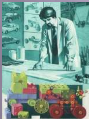
Промисловий дизайн (транспорт)