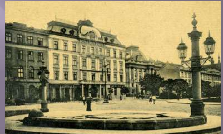
Листівка бл. 1906