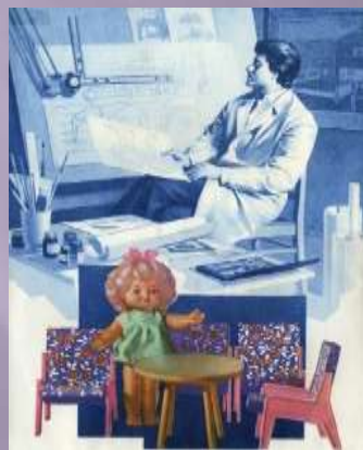
Дизайн середовища (інтер'єрів та екстер'єрів)