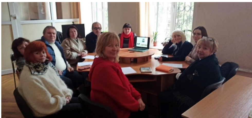
Рис. 1. Звітне засідання відділу наукового інформаційно-аналітичного супроводу освіти Державної науково-педагогічної бібліотеки України імені В. О. Сухомлинського (22.12.2022 р.)