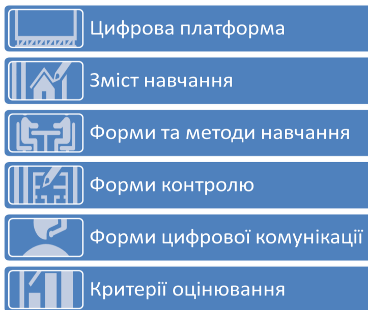
Рис. 1. Організаційні складники дистанційного навчання керівників закладів освіти