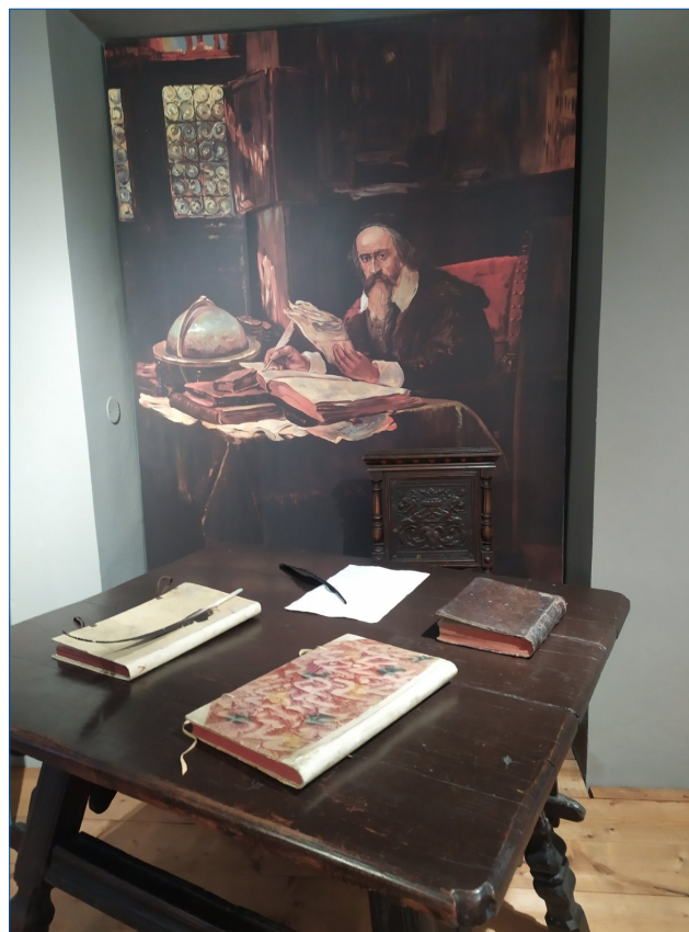
Національний педагогічний музей та бібліотека Я. А. Коменського

Із вітальним словом до учасників звернулися: заступниця Міністра освіти, науки, молоді та спорту Чеської Республіки професорка Радка Вільдова, директорка Національного педагогічного музею та бібліотеки Я. А. Коменського професорка Маркета Панкова, керівник кафедри педагогіки і психології, професор Технічного університету Ліберця професор Томаш Каспер та ін. (NPMK, 2023b).