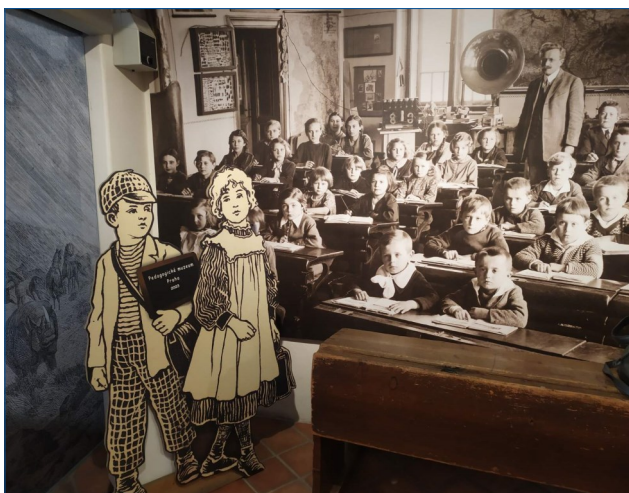
Національний педагогічний музей та бібліотека Я. А. Коменського

and Youths» («Дитина в часи бід і надії. Подолання лиха війни, епідемій, соціальних, психологічних і фізичних вад у дітей та молоді»), яку організували Національний педагогічний музей та бібліотека Я. А. Коменського, факультет мистецтв Карлового університету в Празі, Інститут історії Чеської академії наук (Центр історії освіти), Технічний університет Ліберця, Цюрихський і Дрезденський університети. У заході взяли участь більш як 60 дослідників із 14 країн (Австрія, Бельгія, Боснія і Герцеговина, Італія, Македонія, Німеччина, Польща, Угорщина, Україна, Сербія, Словаччина, Словенія, Чехія, Швейцарія, США та ін.). Захід відбувся на базі унікальної установи — Національного педагогічного музею та бібліотеки Я.А. Коменського (м. Прага, Чехія) 1 . Атмосфера експонатів і артефактів надихала, занурювала в історію освіти різних епох (NPMK, 2023c).