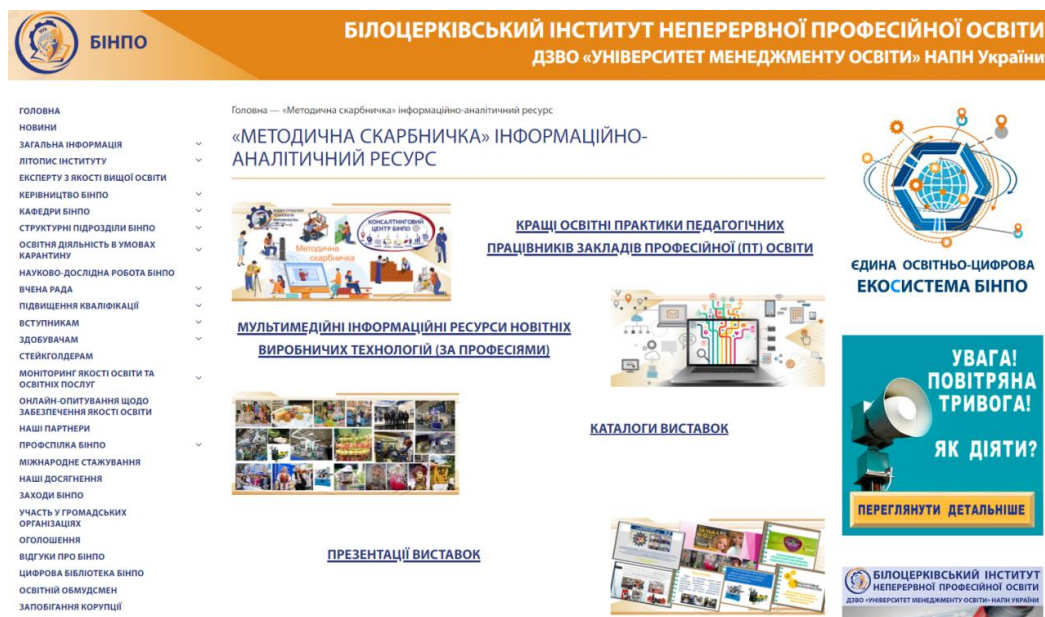
Рис. 2. Розміщення рубрик інформаційно-аналітичного ресурсу «Методична скарбничка»

Рубрики «Кращі освітні практики педагогічних працівників закладів професійної (ПТ) освіти» та «Мультимедійні інформаційні ресурси новітніх виробничих технологій (за професіями)» містять перелік методичних матеріалів згідно з професіями, підготовка за якими здійснюється закладами професійно-технічної освіти України (рис. 2):