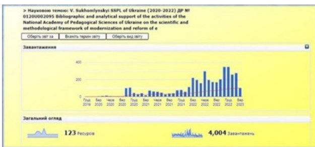
Статистика завантажень в Електронній бібліотеці НАПН України

Про затребуваність нашої наукової продукції свідчить статистика завантажень в Електронній бібліотеці НАПН України – на сьогодні це більш ніж 4 тис. скачувань.