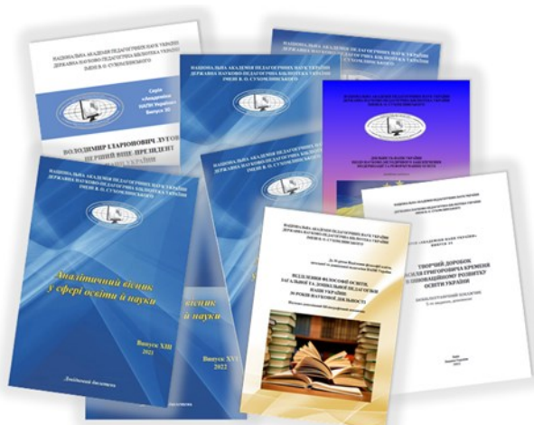
Результати прикладного наукового дослідження

Підготовлено й оприлюднено 15 інформаційних оглядів з питань безпеки життєдіяльності, психологічної допомоги дітям і дорослим, дистанційного навчання, зокрема вивчення української мови тощо для громадян України в умовах воєнного стану. Працівники відділу взяли участь у діяльності групи «Інтернет-війська України» , надавали допомогу в логістиці волонтерській організації UKRAINIAN MUMS UNITED , підтримали поширення вимог щодо санкцій до російських наукових і культурних проєктів, протидії пропаганді рф в інформаційному просторі тощо.