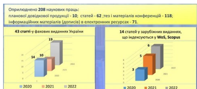
Продукція та найвагомші публікації