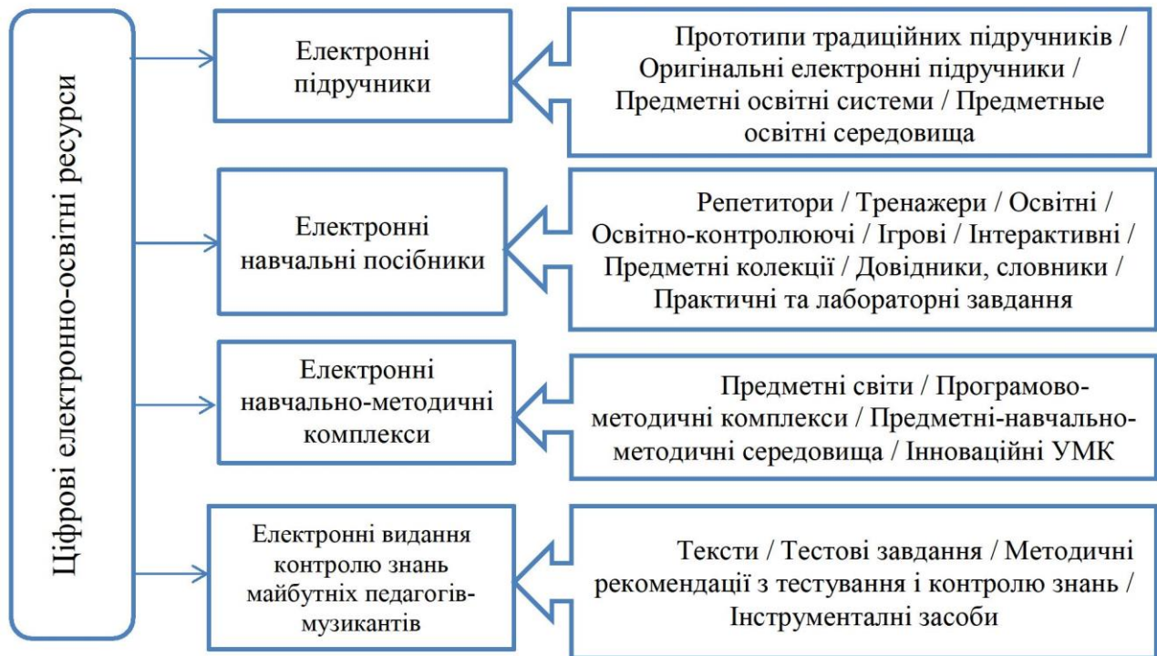
Рис. 1. Класифікація ЕОР за освітньо-методичними функціями

Підсумовуючи, ще раз відзначимо можливості ЕОР, що впливають на успішність процесу навчання і професійно-особистісне зростання: