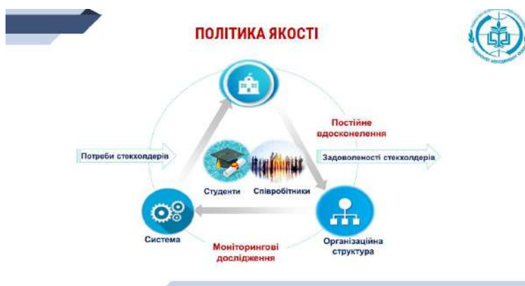
Рис. 6. Циклограма політики якості установи (розроблено НАУ)

Першочергову роль у забезпеченні якості освіти відіграє Політика якості . Політика підприємства, установи – це лаконічно сформульовані напрями й цілі, які визначаються керівництвом: спільна політика, політика в сфері якості, інвестицій тощо. Політика в сфері якості є офіційним документом організації, частиною загальної політики, основою функціонування всієї системи якості. Вона містить стратегічні цілі в сфері якості, сформульовані для досягнення цілей завдання установи та зобов'язання (особливо з боку керівництва). Політика у сфері якості має бути сформульована так, щоб зробити цілеспрямованою діяльність кожного співробітника. У ній повинні бути чітко визначені рівні стандартів якості роботи для ЗВО і розглянуті усі аспекти системи забезпечення якості. Формулювання політики у сфері якості має бути короткою і доступною для сприйняття. Цілі та політика у сфері якості сформульовані керівництвом ЗВО, визначають напрями діяльності установи продовж його існування. Цілі не можна часто змінювати. Зазвичай вони змінюються тоді, коли ЗВО приймає рішення про повну переорієнтацію своєї діяльності. Політика у сфері якості є елементом загальної політики і затверджується вищим керівництвом [19].