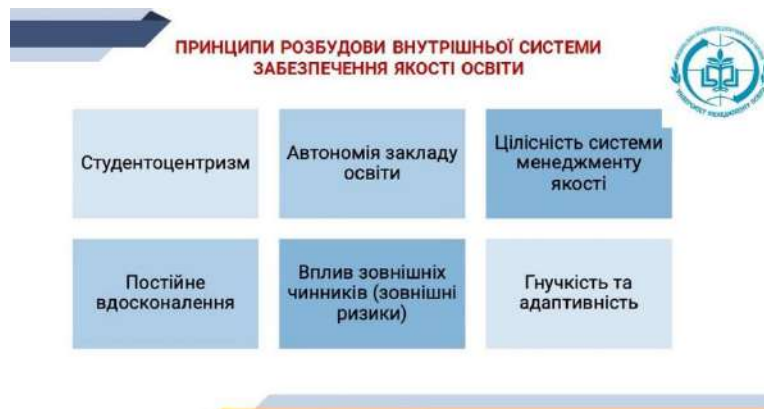
Рис. 2. Принципи розбудови внутрішньої системи забезпечення якості освіти [5, с. 3]

Розглянемо оцінювання якості освітньої діяльності закладів освіти через: