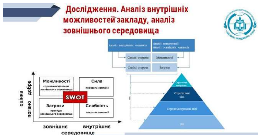
Рис. 7. Схематичний аналіз внутрішніх можливостей закладу освіти [20, 21]

Визначивши усі чинники, буде значно простіше прийняти рішення: посилити слабкі сторони закладу освіти завдяки наявним ресурсам чи відмовитися від ризикованого напрямку розвитку, зменшивши потенційні зовнішні загрози. Загалом стратегії мають бути сфокусовані на акумуляції сил та використанні можливостей, що дозволить уникнути чи подолати загрози.