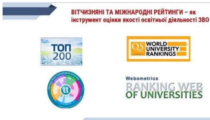
Рис 3. Інструменти оцінки якості освітньої діяльності закладів вищої освіти

Рейтинг вишів «ТОП-200 Україна» оприлюднюється щорічно. Це академічний рейтинг українських закладів вищої освіти.