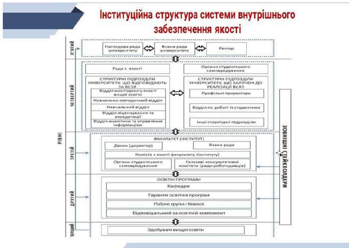
Рис. 1. Схема рівнів інституційної структури внутрішньої системи забезпечення якості [4]

Основними принципами функціонування системи забезпечення якості освіти можна вважати: