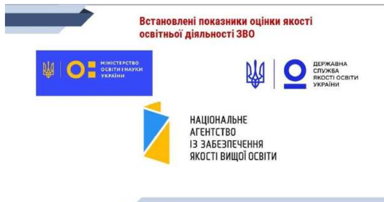
Рис. 4. Установи, що встановлюють показники оцінки якості освіти та освітньої діяльності

Постановою Кабінету Міністрів України від 30 грудня 2015 р. № 1187 «Про затвердження Ліцензійних умов провадження освітньої діяльності» (із змінами, внесеними згідно з Постановою КМ від 24.03.2021 р. № 365) визначено Спеціальні вимоги щодо започаткування та провадження освітньої діяльності . Серед яких: започаткування та провадження освітньої діяльності на рівні вищої освіти. Пунктом 34 визначено кадрові вимоги щодо започаткування та провадження освітньої діяльності за рівнем вищої освіти та освітніми програмами, що передбачають присвоєння професійної кваліфікації з професій, для яких запроваджено додаткове регулювання [14]. Пунктом 38 передбачено вимоги щодо досягнення у професійній діяльності, які зраховуються за останні п'ять років :