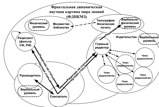
Рис. 1. Редакционно-издательский процесс в рамках фрактальной динамической научной картины мира знаний

Вот, например, Ю. В. Сенько четко показывает формирование научного стиля мышления [14]. Размытость представления методов, средств и прочих технологий во время учебного занятия, описанных в диссертационных работах, не вызывает сомнения у большинства педагогического научного общества. Личный опыт организации и проведения международных научных конгрессных мероприятий, которые являются неотъемлемой частью хода докторского диссертационного исследования [1], позволил установить достоверность вышеупомянутого умозаключения. Дело в том, что любой редакционно-издательский процесс можно представить в следующем виде (рис. 1).