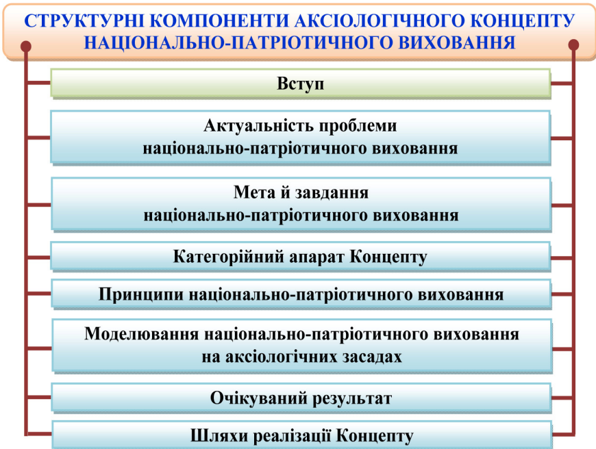
Рис. 1. Структурні компоненти аксіологічного концепту національно-патріотичного виховання

Структурні компоненти Концепту подано на рис. 1.